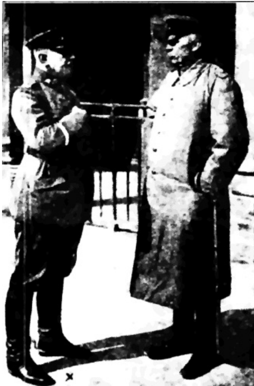
LUDENDORF (croix) ET VON BUELOW