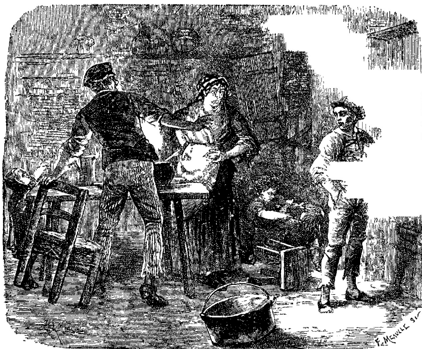
«Goeden avond» juichte de jongen