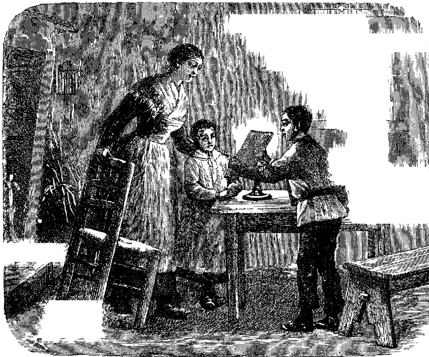
Hij opende een groot schrijfboek, trok er een blad papier uit.

"Onmogelijk, Zuster," antwoordde bazin Wildenslag met eenen zucht. "Ik wenschte het ook wel. Vermits ik slechts één kind heb, dat heeft mogen naar de school gaan, zou ik ze willen laten leeren zoolang ze kan; maar mijn man is niet meer te stillen. Wij kunnen zóó niet leven. De kinderen kosten geld. Ik heb er niet minder dan zes; en, gelooft mij of niet, ze eten ons waarlijk het haar van het hoofd. Als de kinderen hunnen eigen kost niet verdienen, zoohaast ze groot genoeg zijn, dan moeten al de menschen van onze soort naar de armen."