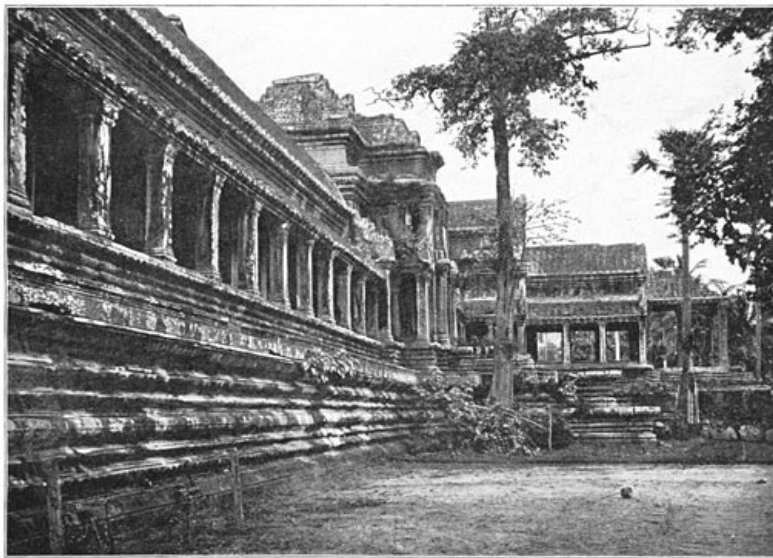
Het groote kloosterplein.

De hutten, waar de bonzen of priesters rondom den tempel wonen, vormen met de monumenten een aangrijpende tegenstelling. Het dorp is niets dan een verzameling stroohutten. Wij logeerden onder een groot afdak, in een aan alle kanten open ruimte. De vloer rustte op hooge palen en bestond uit een open vlechtwerk van bamboes, terwijl de bamboeladder toegang gaf tot dit hôtel. 's Nachts, toen wij ons op onze matrassen telkens omkeerden, gekweld door ontzagwekkende droomen, klonken overal om ons heen de neusklinken van 't psalmgezang der bonzen, die een soort van litanie aanhieven. Dat duurde lang en begon al vroeg weer in den morgen als antwoord op het gekraai der ontwakende hanen. En gedurende de enkele uren van rust, ons gelaten door die vrome zangen, waren er allerlei vreemde geluiden, wel geschikt om den reiziger te verschrikken, die daar in de open lucht ligt in het land van schorpioenen en slangen. Het waren onze ossen, die onder ons afdak vastgemaakt waren en die telkens bewogen of kauwden of zich zacht de lenden wreven.