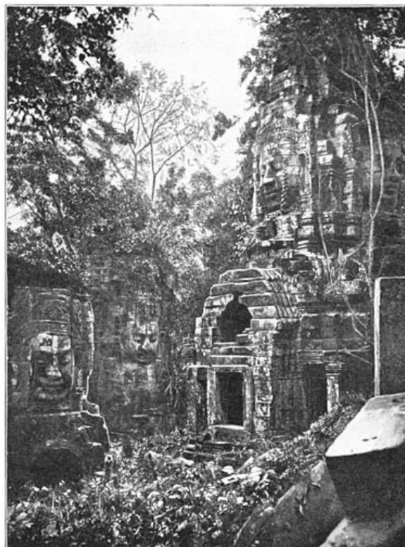
Een khmersch paleis door planten overmeesterd.

Creating the works from print editions not protected by U.S. copyright law means that no one owns a United States copyright in these works, so the Foundation (and you!) can copy and distribute it in the United States without permission and without paying copyright royalties. Special rules, set forth in the General Terms of Use part of this license, apply to copying and distributing Project Gutenberg™ electronic works to protect the PROJECT GUTENBERG™ concept and trademark. Project Gutenberg is a registered trademark, and may not be used if you charge for an eBook, except by following the terms of the trademark license, including paying royalties for use of the Project Gutenberg trademark. If you do not charge anything for copies of this eBook, complying with the trademark license is very easy. You may use this eBook for nearly any purpose such as creation of derivative works, reports, performances and research. Project Gutenberg eBooks may be modified and printed and given away—you may do practically ANYTHING in the United States with eBooks not protected by U.S. copyright law. Redistribution is subject to the trademark license, especially commercial redistribution.