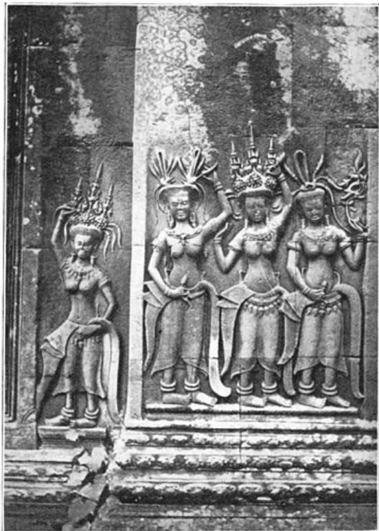
Bas-reliëf van den Angkortempel.

den top. Daar stonden op een groot terras twee pnom's naast elkander, precies gelijk, alleen was de eene ingelegd met guirlanden en rozetten van gekleurd porselein. Rondom ieder voetstuk droegen enorme olifantskoppen het zware monument.