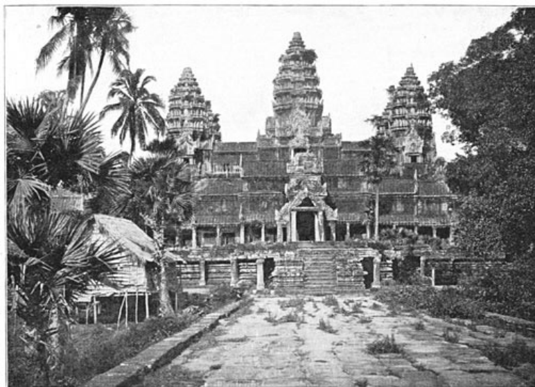
De drie torens van den tempel van Angkor-Wat.

Van Saigon naar Pnom-penh en naar Compong-Cjuang.—Roeitocht op het Groote Meer.—Karren uit Cambodja.—Siem-Reap.—De tempel van Angkor.—Angkor-Tom.—Verval der khmersche beschaving.—Ontmoeting met den tweeden koning van Cambodja.—Oedong-de-Verhevene, hoofdstad van Norodom's vader.—Het paleis van Norodom te Pnom-penh.—Waarom Frankrijk niet aan Siam het grondgebied van Angkor kon overlaten.