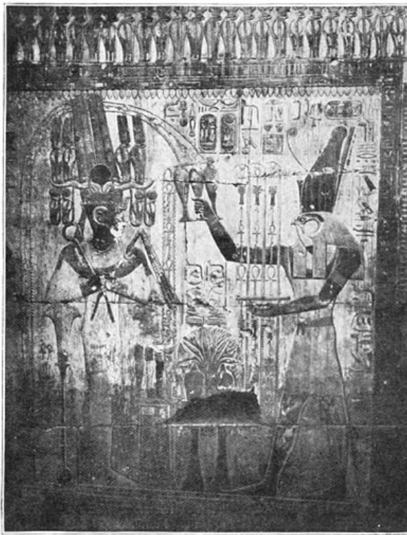
De god Thot, den heerscher Seti I zuiverend.