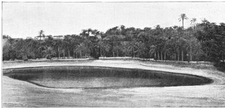
Het heilige meer van Osiris, ten zuidoosten van den tempel.

De legende van Osiris.—Geschiedenis van Abydos in den tijd der egyptische dynastieën en in den christelijken tijd.—De monumenten der stad en hun berooving.—De tegenwoordige inwoners en hunne zeden.