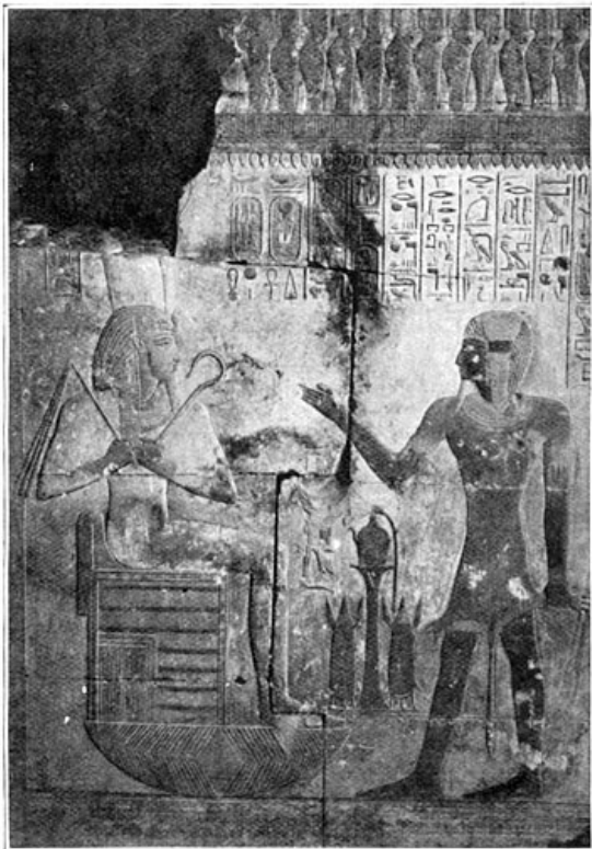
De priesterkoning, Seti I hulde bewijzend.

manieren ontwijdde, zoodat deze ten slotte nog voor een deel gespaard zijn gebleven door de vuilheid en de onverschilligheid der bewoners.