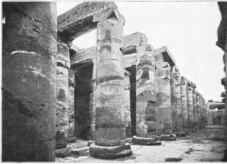
Perspectief van de tweede zaal in den tempel van Seti I.

Naast deze aanhangers van Set staan dan de aanhangers van Osiris, waar de eersten altijd mee lachen, nu zoowel als vroeger. Die vreedzame luidjes leverden het hoofdcontingent der werklieden bij de door mij geleide werken; maar ook zij zijn aangestoken door de leer van Osiris' tegenstander, zij hebben slechts matigen eerbied voor eens anders eigendom. Zij betoonden mij grooten eerbied, dankbaar dat ik hun iets liet verdienen, en soms noodigden ze mij uit, om enkele voorstellingen bij te wonen, gelijk aan die, welke op de graven waren afgebeeld, zoodat ik mij kon voorstellen, dat de godin Isis, de groote toovenaar, nog altijd zooveel macht had als haar in 't verleden werd toegeschreven.