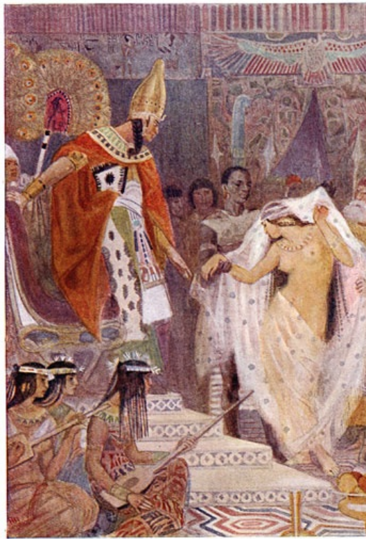
Het meisje van Bekhten.