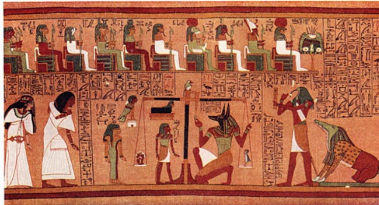
Het wegen van het hart.

Hier luistert hij naar de gebeden van de levenden, ten behoeve van de dooden en beziet de offeranden door de eersten gebracht. Gedurende zijn reis trekt hij door de twaalf afdeelingen van de Duat. Hierbij komen wij streken tegen, welke waarschijnlijk geheel afgescheiden rijken der dooden waren, zooals het rijk van Seker een god, die waarschijnlijk veel ouder dan Osiris is.