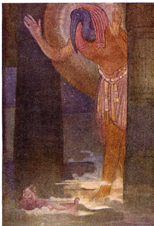
Thoth en de oppertoovenaar.