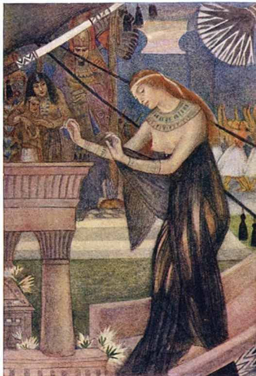
Het vertrek van Isis uit Byblos.

Maar Osiris was meer dan een geest van het koren; hij was ook een boomgeest en dit zal wel zijn oorspronkelijk karakter zijn geweest, omdat de boomvereering in de godsdienstgeschiedenis natuurlijkerwijze ouder is dan de vereering der graanvruchten.