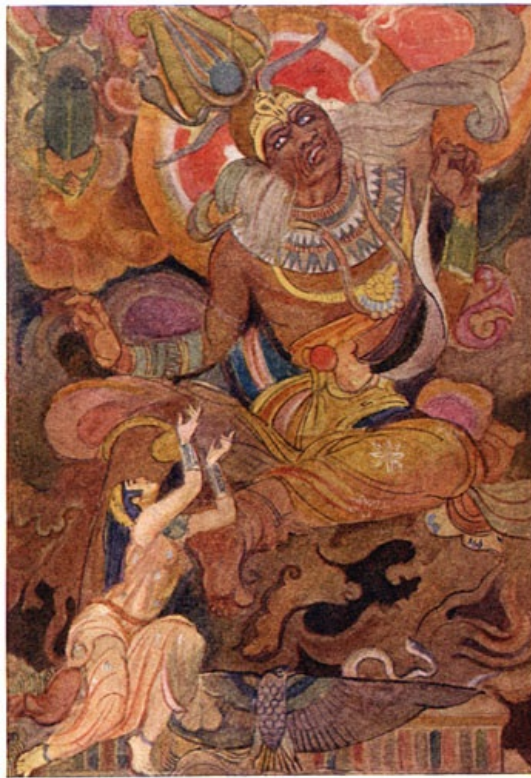
Isis bezweert Ra haar zijn naam te zeggen.