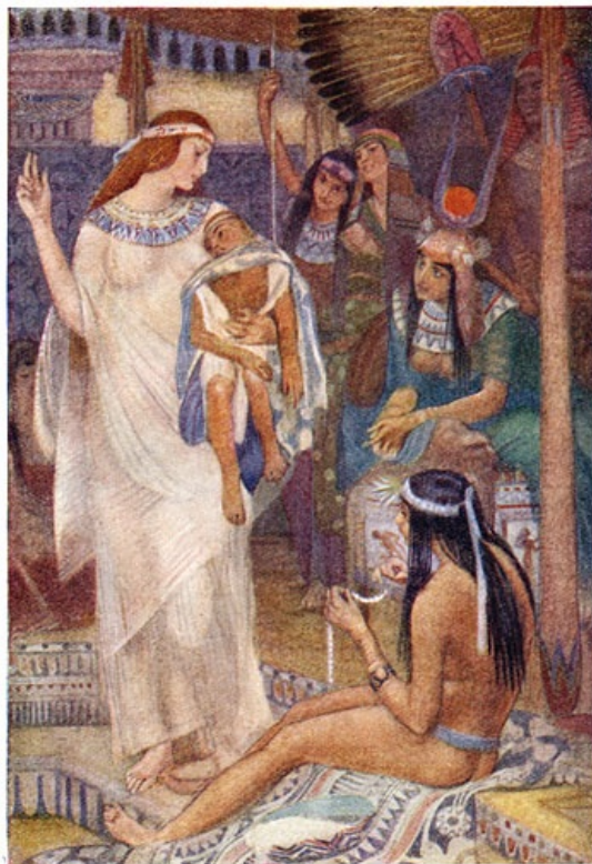
Isis en de jonge prins.

Na dezen tijd plegen de krokodillen geen boot, van papyrus vervaardigd, aan te raken, waarschijnlijk, omdat zij denken, dat deze de godin bevat, die nog altijd zoekende is. Overal waar Isis een gedeelte van het lichaam vond, begroef zij het en bouwde een heiligdom, om aan de plaats een gedenkteeken te geven. Hierdoor komt het, dat er zooveel graven van Osiris in Egypte zijn. 3