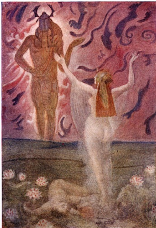
Isis en Ra.