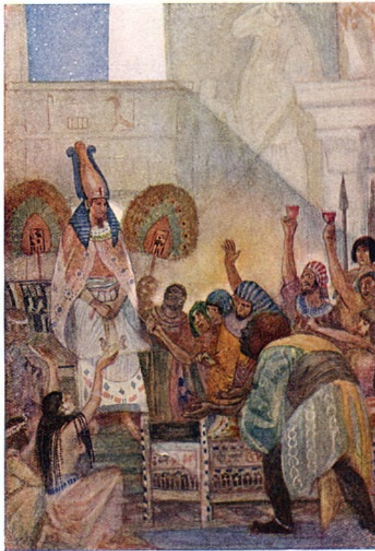
Osiris in de kist gelokt.