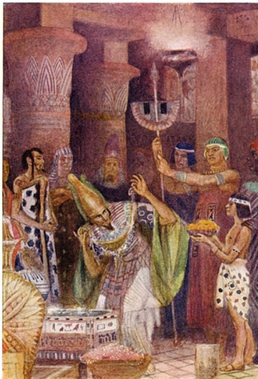
De schatkamer van Rhampsinites.