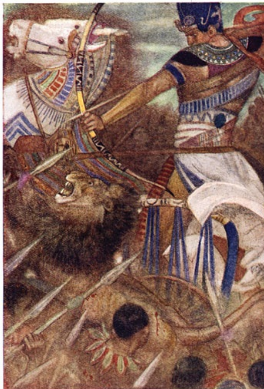
Ramses II door een leeuw vergezeld.