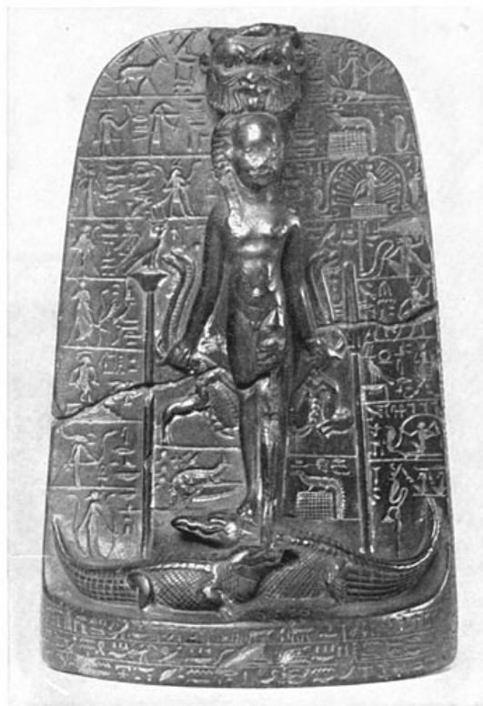
Zuil van Horus.

En hier moet de geschiedenis noodzakelijkerwijs eindigen. Zij is op een zuil gegrift, in den kleinen tempel, welke zich tusschen de klauwen van den Sphinx bevindt en het overige van de inscriptie is zoozeer uitgewischt, dat het niet te ontcijferen is.