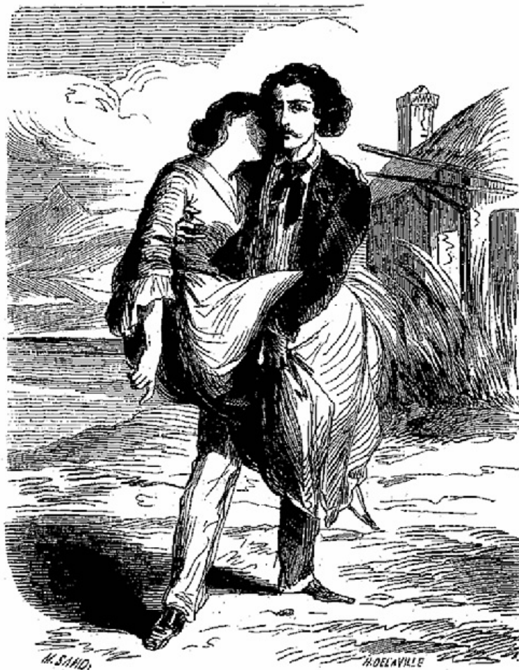
Il prit sa mère dans ses bras.

Elle retrouva, au salon, vers minuit, Salvator qui venait de reconduire Vandoni et qui eut la délicatesse de ne pas lui dire combien il avait trouvé ce brave garçon ridicule et ennuyeux. Elle n'eut pas le courage de lui confier à quel point le prince avait été irrité de la présence de son ancien amant; mais elle ne put s'empêcher d'admirer combien l'amitié est plus indulgente, secourable et généreuse que l'amour. Car elle ne se dissimulait plus les travers de Vandoni, et elle voyait bien que Salvator s'était dévoué pour l'en débarrasser.