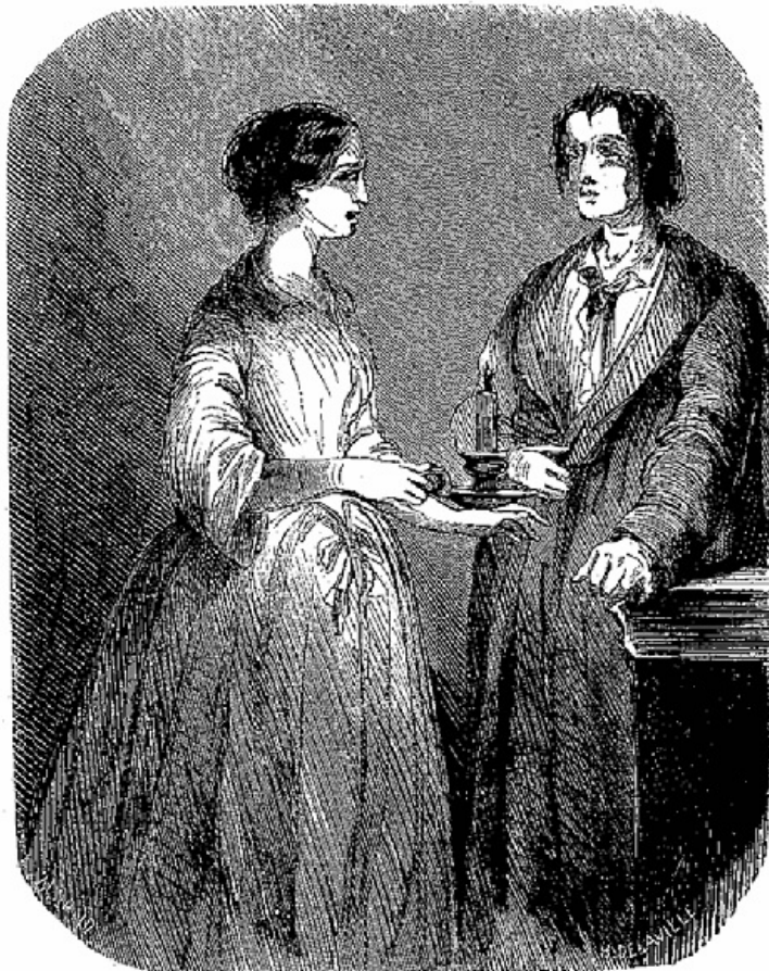
Elle tressaillit en se trouvant en face d'un spectre.