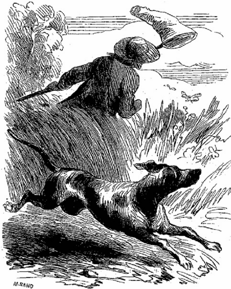
Jusqu'au chien de Célio qui courait

—Eh bien! dit-il en s'élançant dans le parc, cela est écrit ainsi au livre de ma destinée. Pourquoi mes yeux en seraient-ils offensés? O Lucrezia, tu ne m'avais donné que du bonheur; à présent que je vais souffrir par toi et pour toi, je vois à quel point je t'aime!