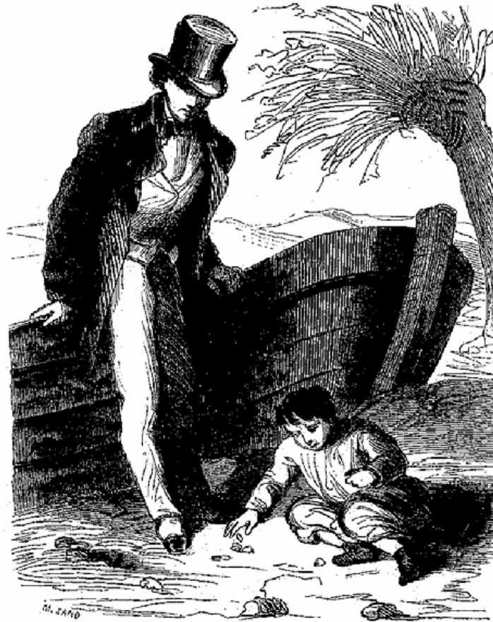
L'étranger s'était appuyé contre la nacelle.

—Votre Excellence a trop de bonté! s'écria Biffi électrisé tout d'un coup. Oh! pardieu! pensa-t-il, c'est bien un vrai prince, je le vois maintenant; mais je n'en dirai rien au père Menapace, car il me garderait mon sequin pour m'empêcher, soi-disant, de le dépenser mal à propos.