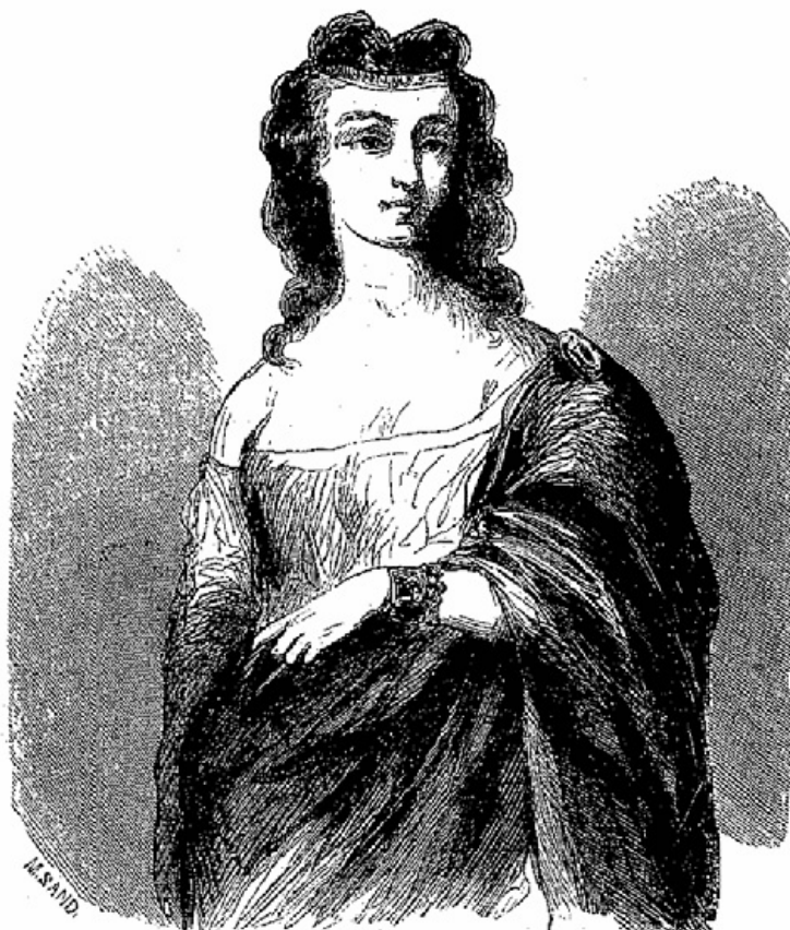
C'était la Floriani.

lassitude et le dégoût avaient calmé son sang, et la préservait d'un entraînement subit.