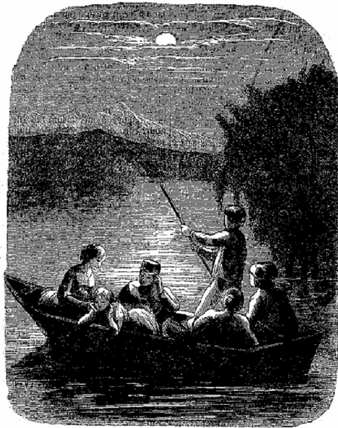
Ils revenaient à la Villa...

Karol trouva un faux-fuyant digne d'un enfant. Il se dit que la Floriani tenait beaucoup à ce chien, que Célio était capable de pleurer un jour entier, s'il ne le retrouvait point; que l'animal était bien jeune, bien fou, et se laisserait peut-être tenter par quelque nouvelle proie avant de rentrer; qu'enfin il pouvait se perdre ou se laisser emmener par quelque chasseur, et que son devoir, à lui, était de le ramener à la maison.