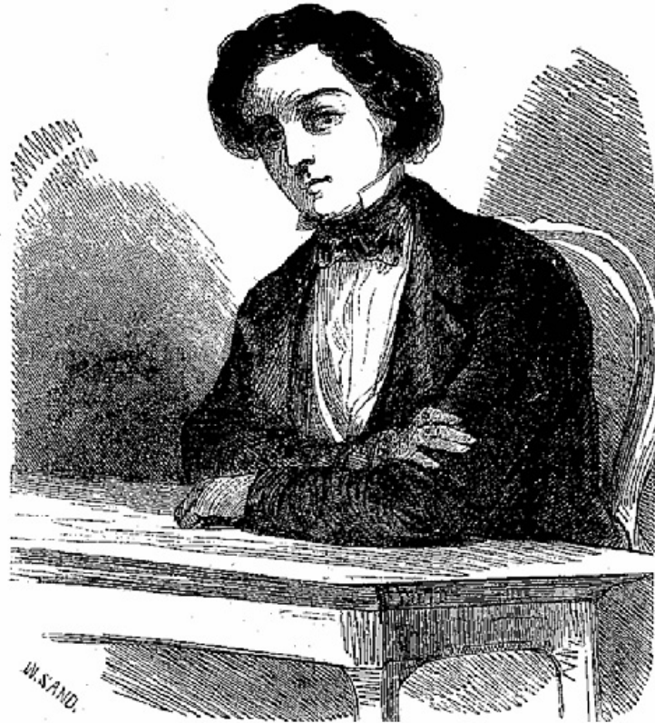
Le prince Karol de Roswald

sauvée. Était-il permis à une femme chargée de tant de fautes de s'abuser à ce point, et de s'imaginer bonnement que la Providence allait la récompenser de ses erreurs au lieu de l'en punir? Non, cela n'était point permis, et pourtant la Lucrezia s'en accommoda avec sa naïveté habituelle.