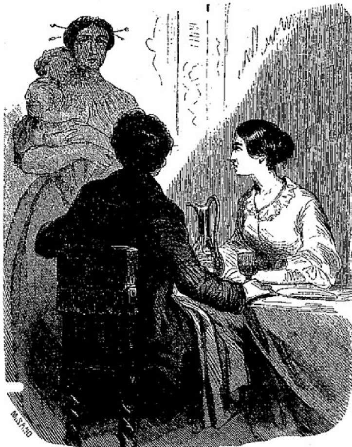
Voilà une superbe nourrice, s'écria Salvator

—Et à présent, mon ami, tu te moques ou tu déraisonnes, dit la Floriani avec la tranquille modestie que donne l'habitude de régner. Ne parlons pas légèrement de choses sérieuses, je t'en prie.