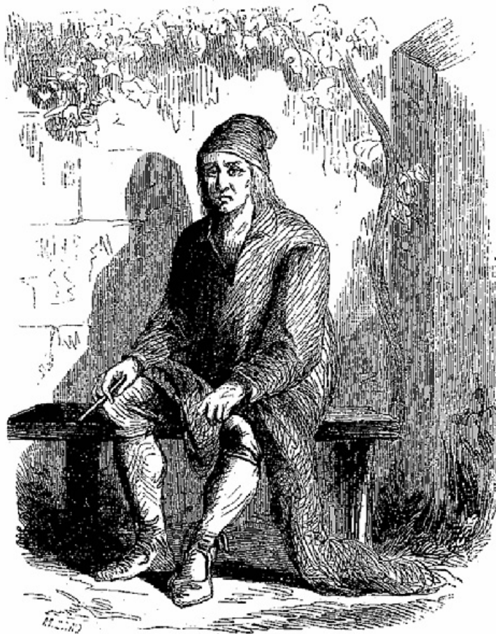
Il était assis à sa porte...