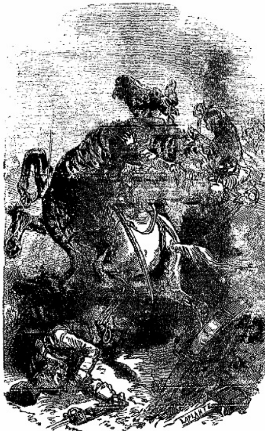
Louison lui sauta à la gorge.

Une heure plus tard, la bataille était terminée, et les Anglais, reconduits à coups de sabre sur la route de Bombay, ne pensaient plus qu'à rendre leur retraite moins désastreuse.