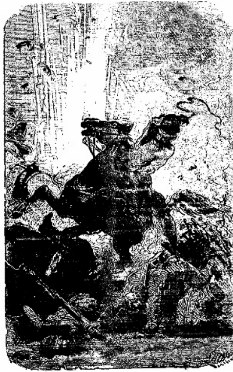
Les caissons commencent à éclater.

Le feu avait envahi d'abord le quartier des marchands et des vivandières qui suivaient l'armée. En un moment, tout fut consumé. Puis, la flamme s'étendant toujours, gagna bientôt les caissons de cartouches, qui commencèrent à éclater en l'air. Déjà tous les hommes attachés au service des équipages de l'armée se répandaient au bas de la colline, fuyant les détonations de toute espèce; les femmes et les enfants les avaient précédés et couraient au hasard en criant: