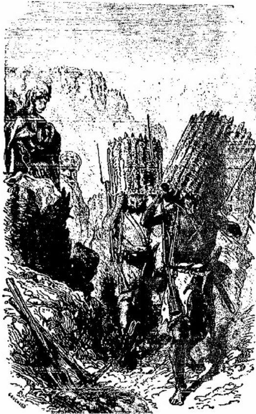
Il fortifia son camp.

Corcoran suivit ce plan avec une persévérance extraordinaire. Il creusa des retranchements, construisit des redoutes, entoura son camp d'un fossé profond, le garnit de palissades au travers desquelles se montraient les gueules de deux cents canons. Puis, à la tête de sa cavalerie montée sur des chevaux berbères et turcomans, sobres, prompts, légers et durs à la fatigue, il battit tout le pays, enleva les convois qui approvisionnaient le camp anglais, et réduisit Barclay presque à la famine.