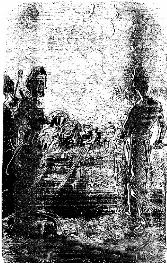
Son artillerie barrait la route aux Anglais.

Son artillerie enfilait la chaussée. Derrière l'artillerie, on apercevait une nombreuse infanterie destinée à la soutenir.