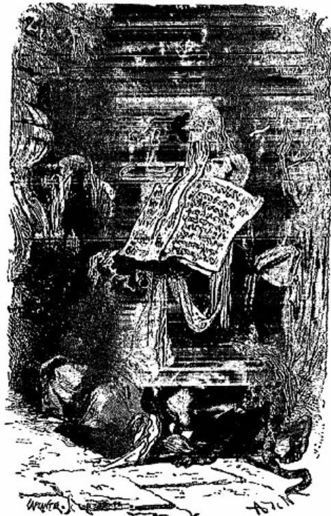
Découverte du Gouroukaramta

Les journaux allemands se partagèrent entre deux camps. Les uns assurèrent que la découverte du Gouroukaramta n'était pas nouvelle; à les entendre, ce livre était depuis longtemps publié; le docteur Cornelius Gunker, de Berlin, l'avait eu dans les mains; le docteur Hauffert, de Goettingue, en préparait depuis longtemps une traduction; le professeur Spellart, d'Iéna, écrivait un commentaire sur son origine probable. L'autre camp déclara nettement que le manuscrit était faux, que la copie envoyée par Corcoran était l'oeuvre de son imagination; qu'il n'avait lui-même jamais vu ni le Gouroukaramta, ni l'Inde; que les philologues français étaient faits tout au plus pour nouer et dénouer les cordons des souliers des philologues allemands; que cette nation vaniteuse et légère qui habite entre le Rhin, les Alpes, la Méditerranée, les Pyrénées et l'océan Atlantique, était incapable de rien écrire ou dire qui fût utile et bon; qu'elle ne saurait jamais que danser et faire l'exercice à feu; que si par hasard quelqu'un de ses citoyens avait un peu plus de sens et de jugement que les autres, il le devait à son origine germanique, étant nécessairement né en Lorraine ou en Alsace; qu'il fallait, par conséquent, reprendre ces deux provinces allemandes, frauduleusement détachées de la grande patrie d'Arminius, et qu'enfin le sabre allemand, la pensée allemande, la critique allemande, la sagesse allemande et la choucroute allemande (bien entourée de saucisses) étaient au-dessus de tout.