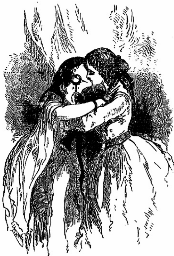
Elle embrassa Sita avec une tendresse véritable.

Alice se défendit quelque temps de l'accepter, quoiqu'elle en brûlât d'envie; mais la générosité de Sita lui faisait sentir bien délicatement la dureté qu'elle venait de montrer.