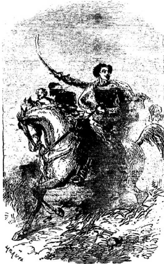
Corcoran passa au travers des Anglais.

Cependant le combat resta quelque temps incertain. Les Anglais, étonnés d'abord de l'impétuosité de Corcoran, mais bientôt rassurés par le mépris que leur inspirait l'armée mahratte, se rallièrent promptement, et, malgré la chaleur du soleil, firent preuve d'une rare intrépidité. En peu d'instants, ils sabrèrent les premiers rangs de la cavalerie hindoue, et Corcoran, emporté par son ardeur, se trouva enfermé dans leurs rangs. Déjà il se croyait abandonné et ne pensait plus qu'à vendre chèrement sa vie, lorsqu'un secours imprévu lui rendit la victoire.