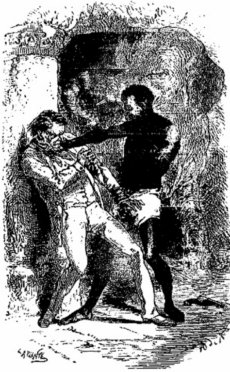
Acajou, bon nègre, arrête le traître Ruskaert.

—C'est bien, maître Acajou! dit Corcoran. Voici vingt roupies. Massa Quaterquem sera très-content de vous.»