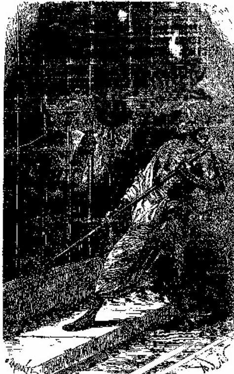
Elle rugissait si terriblement que le palais en trembla.

Celle-ci, cependant, ne perdait pas courage. Voyant que personne ne viendrait la délivrer, elle bondit tout à coup d'un élan furieux, enfonça l'une des fenêtres de la salle et, toute sanglante, allait prendre la fuite.