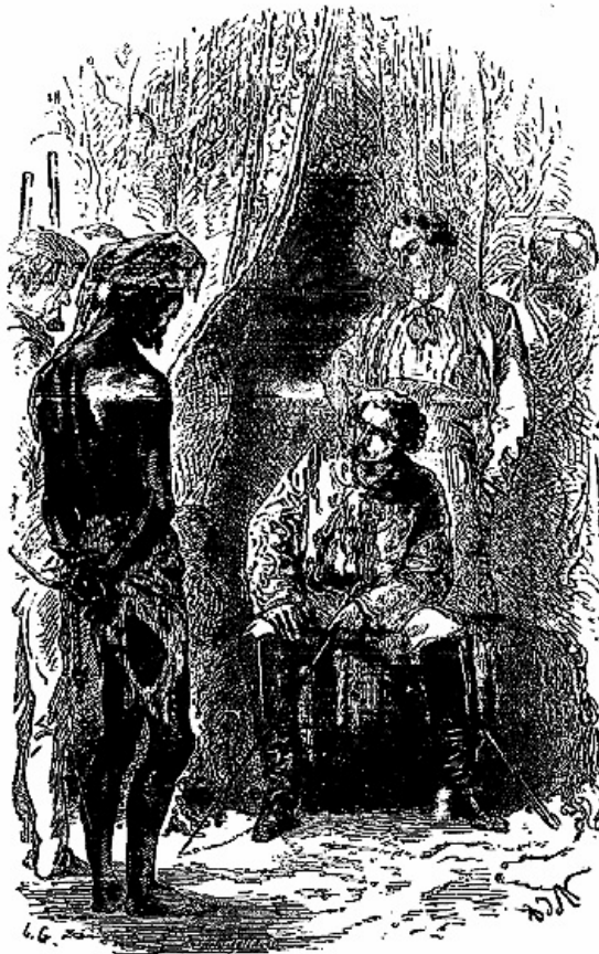
Interrogatoire de monsieur Baber.