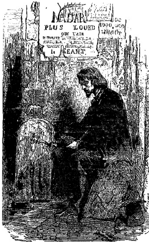
Je mangeais du pain rassis.

—Oh! cher bien-aimé, non! s'écria Mme Quaterquem en s'appuyant doucement sur l'épaule de son mari.