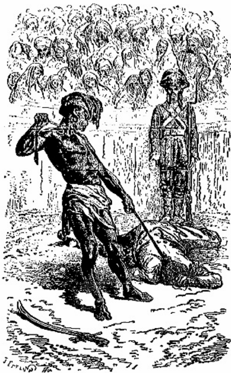
Baber, triomphant, traîne Doubleface.

Là, sans délai, il écrivit la dépêche suivante: