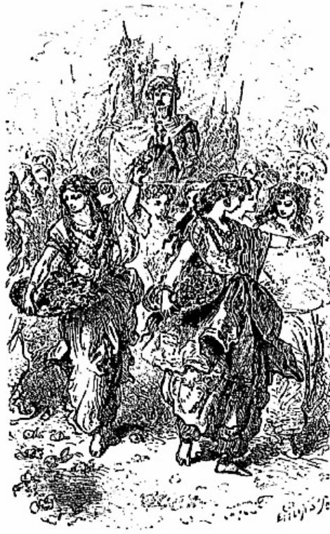
Fêtes en l'honneur de Corcoran vainqueur.