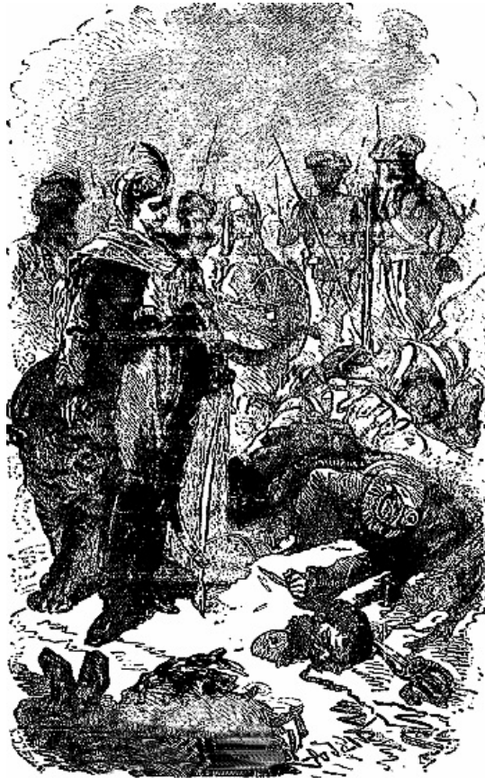
C'était un brave homme.

Dès le lendemain, de bonne heure, Corcoran que la nécessité de tout ordonner et de tout exécuter par lui-même retardait souvent, reprit lui-même la poursuite, et courut sur les traces de l'ennemi.