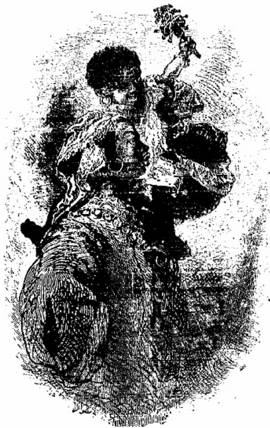
Nini et Zozo.