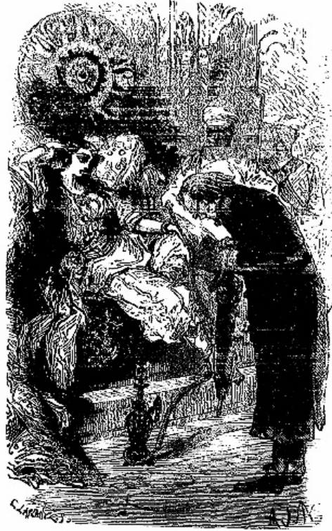
Soyez le bienvenu, dit Sita.

Tout réussit à merveille, et Sita, enchantée du succès de son idée, voulut qu'on donnât l'hospitalité à l'étranger jusqu'au retour de Corcoran.