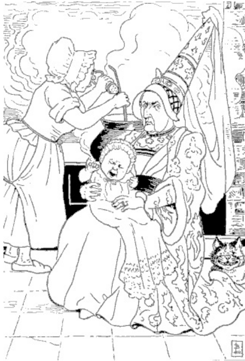
LA DUKINA KUIREJO.

"Ĉion, kion ajn vi volas!" diris la Lakeo, kaj komencis fajfi. Alicia perdis la paciencon.