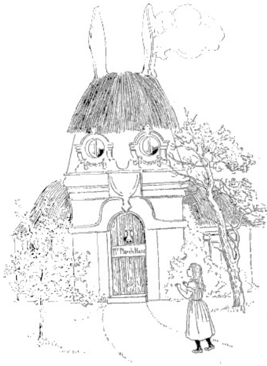
DOMO DE LA MARTLEPORO.

domo, ĉar la du kamentuboj havis la suprojn en formo de longaj oreloj, kaj la tegmento estis kovrita per felo. La domo estis multe pli granda ol la dukina; sekve ŝi ne kuraĝis alproksimiĝi ĝis ŝi mordetis iom de la maldekstra fungopeco, kaj altigis sin ĝis proksimume sepdek centimetroj. Havante tiun altecon ŝi marŝis rekte al la domo, sed ŝi ankoraŭ iom timis dirante al si:—"Malgraŭ ĉio ĝi povas esti furioze freneza. Preskaŭ mi volus esti irinta ĉe la Ĉapeliston."