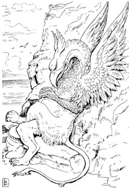
LA GRIFO PROFUNDE DORMIS.

"Nu, la ŝerco estas ŝi mem," diris la Grifo. "Ĉio tio pri la ekzekutoj estas nur ŝia fantazio; oni ja fakte neniun ekzekutas! Tamen, vi rapidiĝu!"