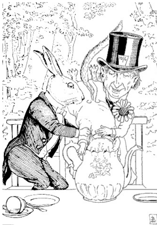
LA GLIRO ESTAS ENIGATA EN LA TEKRUĈON.

"Neniam mi volos reviziti ilin " diris Alicio.