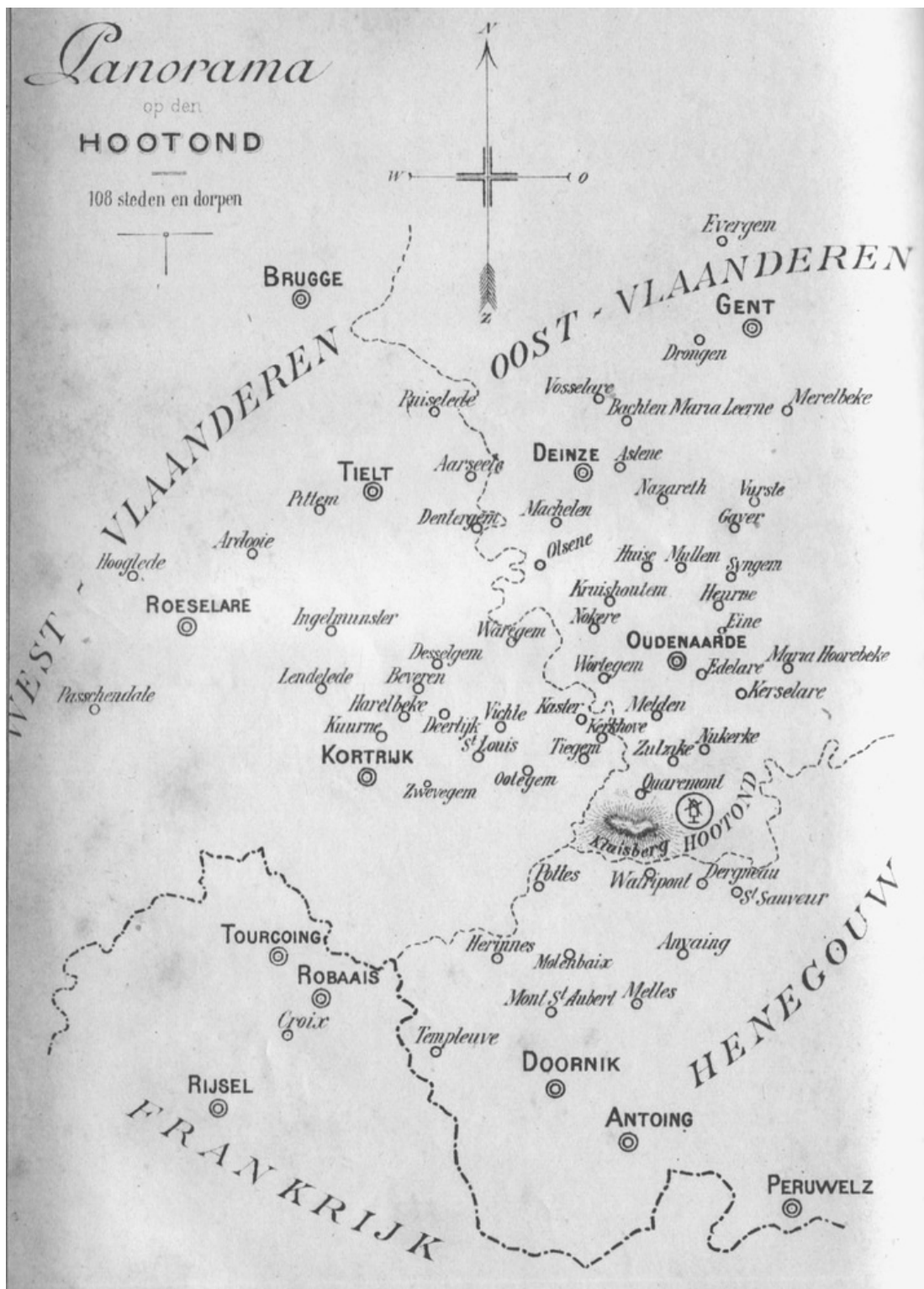
Panorama op den HOOTOND