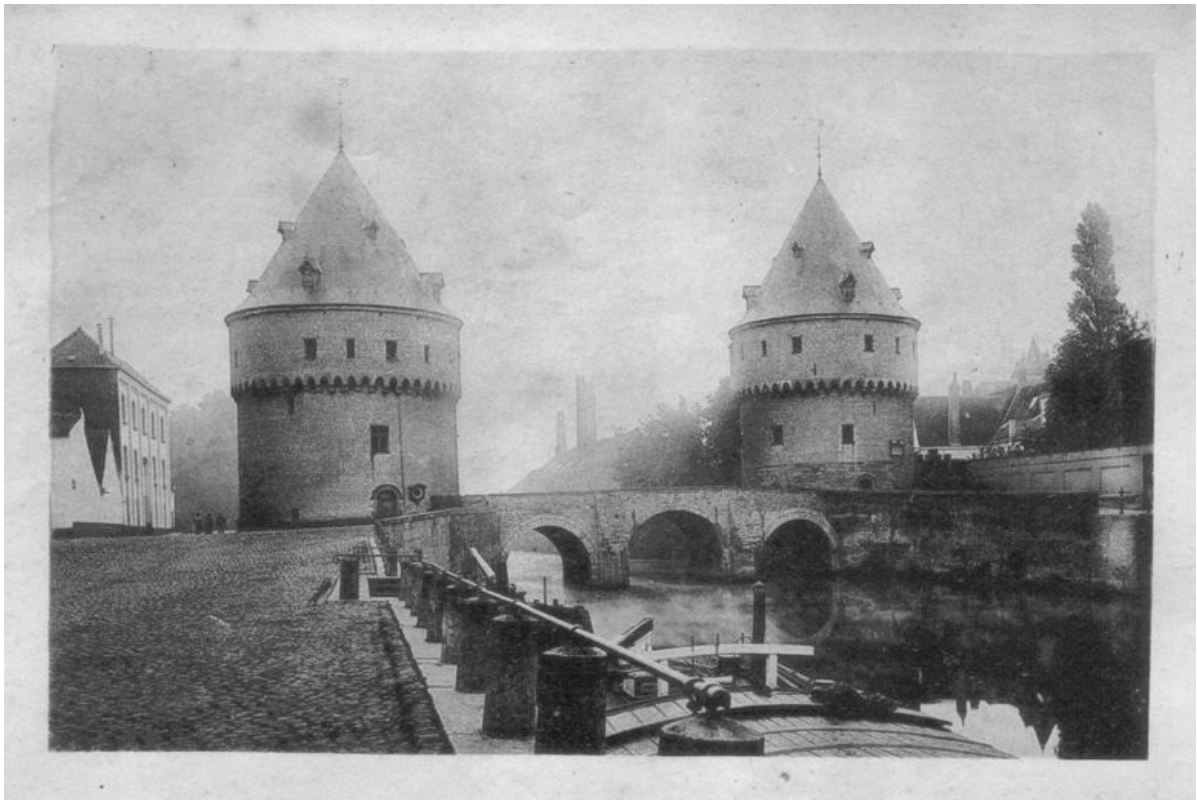
Kortrijk. — De Broeltorens.

Nog rampzaliger waren de laatste jaren der XVIII e eeuw, wanneer men, zooals CONSCIENCE aanmerkt, niets meer eerbiedigde: noch godsdienst, noch zeden, noch eigendom, noch wetten der menschelijkheid.