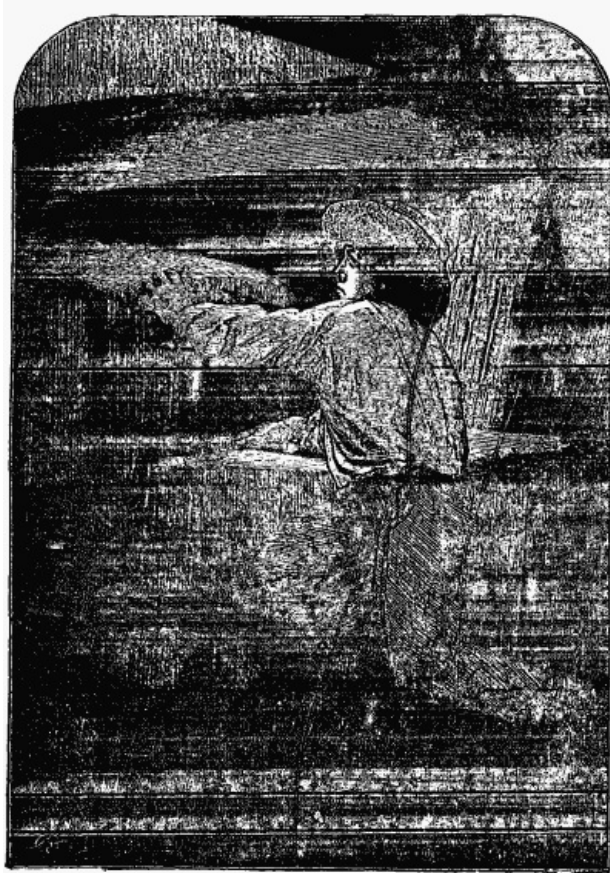
C'était un faible rayon qui passait entre deux planches.

Elle ne pouvait pas venir du pont; il n'existe pas la moindre fissure au plancher d'un navire; et la fente qui laissait pénétrer cette lueur ne pouvait être qu'au volet de l'écoutille, dont le prélat était sans doute enlevé, ou déchiré à cet endroit.