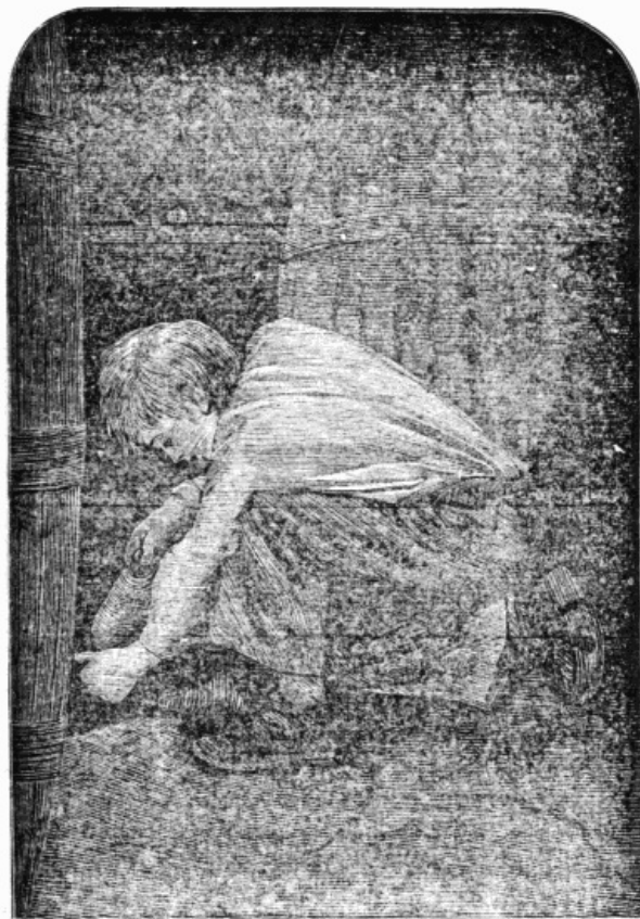
J'attendis mes rats avec confiance.

aussitôt qu'il serait rempli, j'attendis mes rats avec confiance.