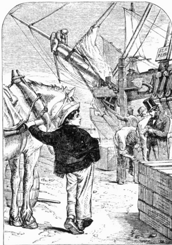
La charrette fut conduite sur l'un des quais.

Il arriva qu'un jour, par hasard, mon oncle me fit accompagner l'un des domestiques de la ferme qui allait mener du foin à la ville; j'étais envoyé pour tenir le cheval pendant que mon compagnon s'occuperait de la vente du foin. Or, il se trouva que la charrette fut conduite sur l'un des quais où les navires faisaient leur chargement: quelle belle occasion pour moi de contempler ces grands vaisseaux, d'admirer leur fine mâture, et l'élégance de leurs agrès!