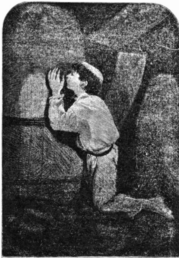
Comme je bus cette eau délicieuse.

Toutefois ce résultat ne fut pas immédiat; la première libation ne me désaltéra qu'un instant; mes lèvres se rapprochèrent bientôt de la barrique, et j'y revins à plusieurs reprises avant d'être complètement soulagé.