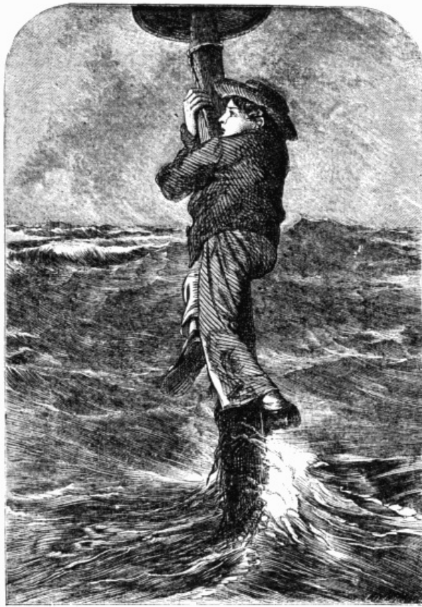
C'est de la sorte que je passai la nuit.

Enfin la marée se retira; vous supposez sans doute qu'en voyant les galets à découvert, je m'empressai de descendre de mon perchoir; vous vous trompez, je n'en fis rien; les rochers ne m'inspiraient pas de confiance, et je craignais en abandonnant mon poste d'être obligé d'y revenir. D'ailleurs c'était le moyen d'être aperçu de la côte; il était probable qu'en me voyant, à la place que j'occupais, on devinerait ma détresse, et qu'on m'enverrait du secours.