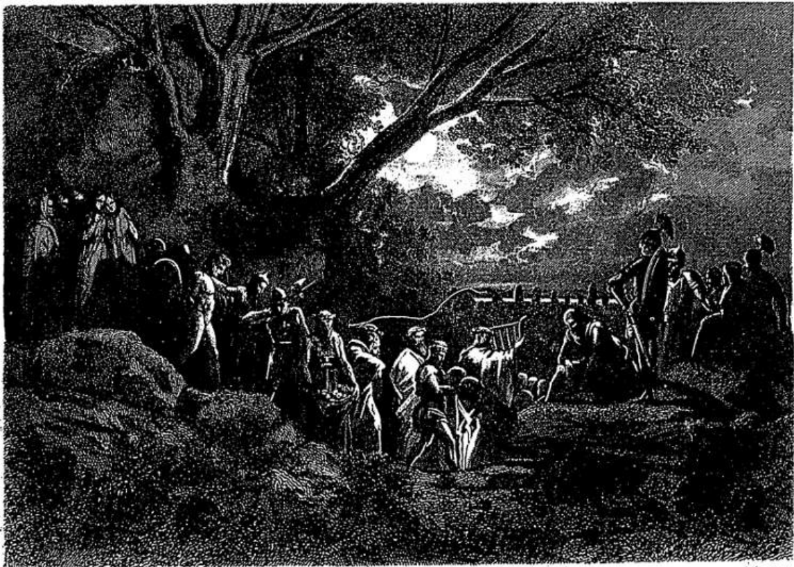
Hêna, la vierge de l'île de Sên.