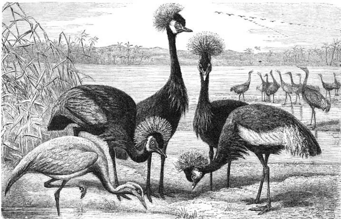
1) Juffer van Numidië ( Grus virgo ) 2) Kroonkraan ( Grus pavonina ).

Onmiddellijk na zijn aankomst in het vaderland neemt het Kraanvogelpaar bezit van het moeras, waarin het van plan is te broeden en duldt binnen een zekeren kring geen tweede paar, hoewel het iederen voorbijtrekkenden zwerm met luid geschreeuw begroet. Eerst als de moerassen groener worden en de struiken in 't blad komen, beginnen de beide Vogels een nest te bouwen. Veel moeite besteden zij hieraan niet: dorre rijsjes worden op een eilandje, een sekgraspol, een platgetrapten struik of een andere verhevenheid bijeengebracht, droge halmen en rietbladen, cypergrassen, biezen en grassen in meer of minder groote hoeveelheid hier opgestapeld en het midden van den hoop een weinig uitgehold. In dit kuiltje legt het wijfje 2 groote, langwerpige eieren met dikke, grof korrelige, bijna glanslooze schaal; deze vertoont op grijsachtig groenen, bruinachtigen of lichtgroenen grond een tekening, die uit grijze en roodachtig grijze ondervlekken, met roodbruine en donkerbruine bovenzakken, stippels en krullen bestaat, doch overigens sterk varieert. Het mannetje en het wijfje broeden om beurten en verdedigen hun kroost tegen een naderenden vijand; zij doen dit gezamenlijk, wanneer diegene, welke niet broedt, maar de wacht houdt op het oogenblik van den aanval, dezen niet alleen kan afslaan. Zij hebben er merkwaardig goed slag van om zich gedurende den broedtijd aan het oog van den waarnemer te onttrekken en de plaats waar zij nestelen, niet te verraden.