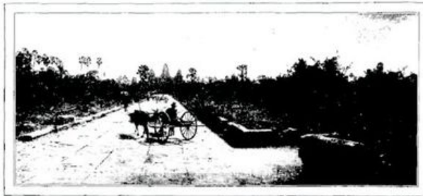
UNE CHAUSSÉE DE PIERRE S'AVANCE AU MILIEU DES ÉTANGS (page 363).—D'APRÈS UNE PHOTOGRAPHIE.

Assis sur les marches d'un de ces portiques, les pieds sur une corniche aux sculptures effritées, nous regardons le soleil se coucher derrière le feuillage de la forêt. Au-dessous de nous, les cours et les cloîtres se voilent d'obscurité, tandis que, à la hauteur où nous sommes, le sanctuaire flamboie des derniers rayons. Successivement, disparaissent les colonnes, les chapiteaux et ces bas-reliefs, partout reproduits, où se déploie l'interminable théorie des bayadères sacrées. Bientôt, nous distinguons à peine les toitures aux lourdes pierres, longues et arrondies, qui s'alignent et se creusent avec la régularité des sillons dans nos champs. Seule, apparaît parfois la robe jaune d'un bonze qui frôle la muraille en faisant sa ronde.