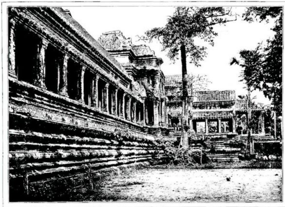
LA PLUS GRANDE DES DEUX ENCEINTES MESURE 2 KILOMÈTRES DE TOUR; C'EST UN LONG CLOÎTRE (page 364).—D'APRÈS UNE PHOTOGRAPHIE.

Les Fellahs n'ont-ils pas construit les Pyramides? N'est-ce pas aux Cinghalais qu'on doit les colosses d'Anuradhapura, dans l'île de Ceylan? Ces peuples asservis travaillaient pour le compte du maître, et par la puissance de leurs millions de bras, lui permettaient d'accomplir des prodiges auxquels leur intelligence n'avait nulle part. Machines humaines, ils se mouvaient sous la direction d'une élite peu nombreuse, et ils retournèrent à la simplicité de la nature, le jour où disparut cette aristocratie combinée de la puissance et du génie.