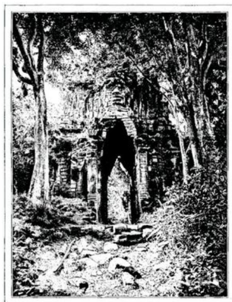
PORTE D'ENTRÉE DE LA CITÉ ROYALE D'ANGKOR-TOM, DANS LA FORÊT (page 365).—D'APRÈS UNE PHOTOGRAPHIE.

Blottis en boule sur ces matelas, comme sur un lit de cendres, tâchant de nous abriter tout entiers sous nos ombrelles, nous entrevoyons parfois, pointant sur le sommet d'une colline grillée, ou émergeant d'une vague oasis, les dômes orgueilleux de quelques ruines khmer; et l'apparition de ces monuments grandioses au milieu de cette nature chétive nous rassure et nous attriste en même temps. Quel souffle a donc passé de ce sol brûlé sur ces ruines? Et cette déchéance mortelle, dont le spectacle nous saisit l'âme, qui de l'homme ou de la nature en a été la cause originelle?