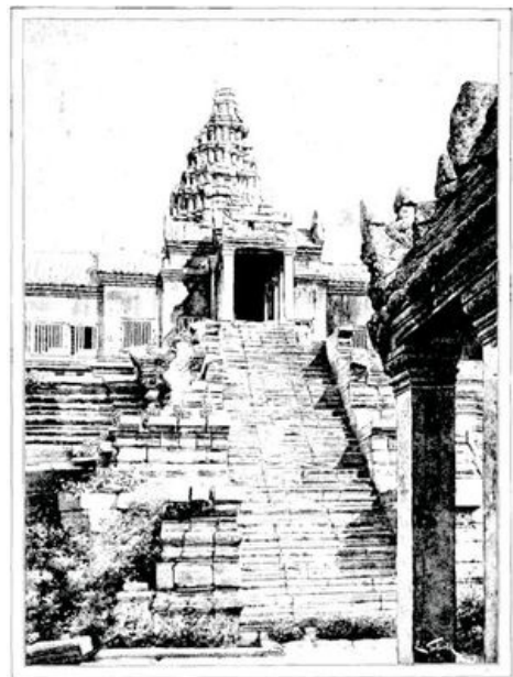
PAR DES ESCALIERS INVRAISEMBLABLEMENT RAIDES ON GRAVIT LA MONTAGNE SACRÉE (page 364).—D'APRÈS UNE PHOTOGRAPHIE.

Sur le bord d'une clairière, voici un monticule tout embroussaillé d'une végétation géante, et au milieu des arbres, aux têtes ambitieuses, pointent des masses sombres, énigmatiques, qui semblent leur disputer une place au soleil. Ce monticule n'est autre qu'un monument de l'art khmer, temple, palais ou tombeau; et sur ses robustes voûtes, comme sur un terrain solide, la forêt s'est étendue. Les cours, les portiques, les élégantes colonnades, les terrasses, les escaliers dressés comme des échelles, le labyrinthe des salles, les étages effondrés, tout est envahi par cette végétation inconsciente qui détruit elle-même son piédestal. Au-dessus du triple étage des voûtes, on se promène sur un sol jonché de débris énormes, de colonnes, de pierres de taille. Partout des dômes se dressent au-dessus des ruines, comme des gardiens immuables. Ce sont d'ordinaire quatre têtes géantes réunies sous un même bonnet; et rien n'a pu faire perdre à ces faces hiératiques leur expression de hautaine sérénité, ni l'injure des arbres qui poussent dans les interstices des pierres et transforment leur majestueuse coiffure en une perruque hérissée, ni l'irrévérencieuse gambade des singes qui frôlent en passant leur visage.