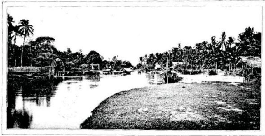
CE GRAND VILLAGE, C'EST SIEM-RÉAP, CAPITALE DE LA PROVINCE (page 362).—D'APRÈS UNE PHOTOGRAPHIE.

s'envolent les coqs et les paons sauvages, nous voyons, passant silencieusement sur le sable ou philosophiquement accroupis, des bandes de ces hommes et de ces femmes bronzés, aux membres robustes, au regard paisible.