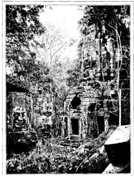
LA FORÊT A ENVAHI LE SECOND ÉTAGE D'UN PALAIS KHMER.—D'APRÈS UNE PHOTOGRAPHIE.