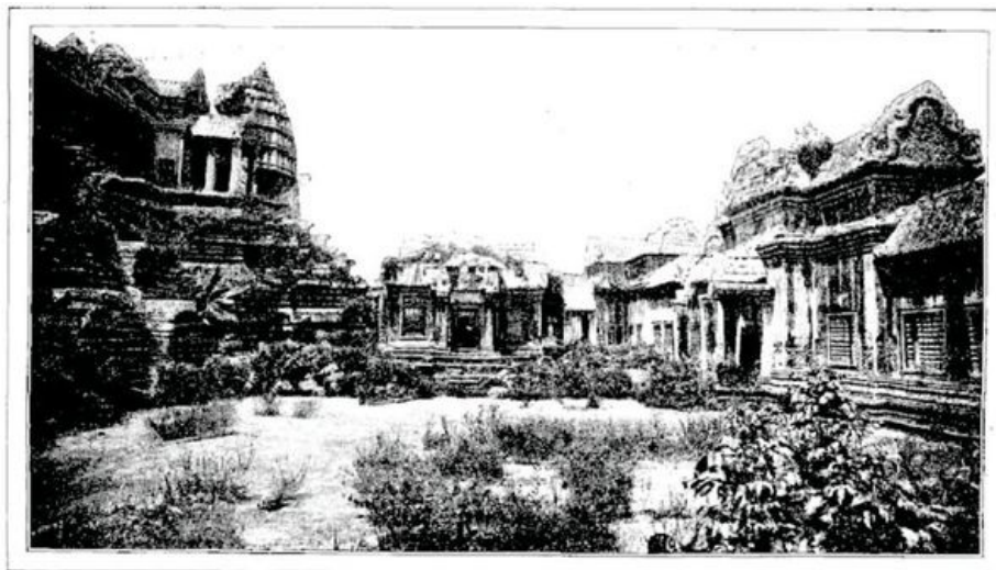
ENTRE LE SANCTUAIRE ET LA SECONDE ENCEINTE QUI ABRITE SOUS SES VOÛTES UN PEUPLE DE DIVINITÉS DE PIERRE.... (page 364).—D'APRÈS UNE PHOTOGRAPHIE.