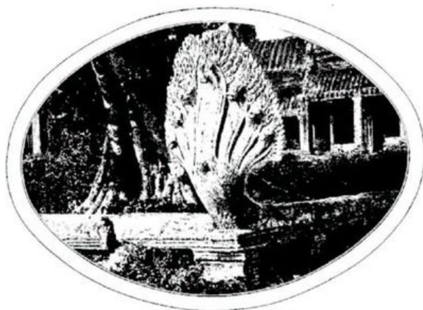
SCULPTURES DE L'ART KHMER.—D'APRÈS UNE PHOTOGRAPHIE.

Droits de traduction et de reproduction réservés.