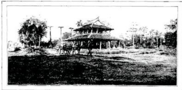
LE PALAIS DU ROI À OUDONG-LA-SUPERBE.—D'APRÈS UNE PHOTOGRAPHIE.

Quelquefois, cependant, Norodom voit grand; alors les immenses enceintes d'Angkor semblent troubler ses rêves. Ainsi, il vient d'achever un monument qui doit illustrer son règne: la grande pagode dorée; et l'inauguration de cet édifice donne cette année aux fêtes du Têt un éclat inaccoutumé. Imaginez-vous une cour carrée aux proportions colossales. Tout autour s'allonge une galerie en bois, et sur le mur qu'elle protège les légendes du Cambodge revivent en des fresques grossières, d'un effroyable coloris. Cette imitation, prétentieuse et naïve à la fois, des admirables bas-reliefs d'Angkor donne la mesure de la décadence de l'art cambodgien. Au centre de la cour, la pagode, aux proportions frêles mais élégantes, aux toitures gentiment retroussées, fait assez bonne impression. Faîtages et corniches, portes et balcons, tout est flamboyant d'or; les balustres sont en marbre rouge, et les colonnes, hardies et légères, ont été taillées dans le plus pur marbre de Paros. Mais notre curiosité de touristes, pareille à celle des enfants qui veulent toucher à tout ce qu'ils voient, nous a coûté la perte de nos illusions. Car, en montant les marches du temple, nous constatons que la blancheur des colonnes n'est qu'un revêtement de plâtre, et que les balustrades sont faites d'une vulgaire poterie, tachée de chaux, pour simuler les veines du marbre.