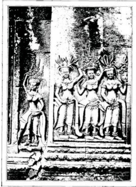
BAS-RELIEF DU TEMPLE D'ANGKOR.—D'APRÈS UNE PHOTOGRAPHIE.

Ils le suivirent si bien, qu'ils abandonnèrent à tout jamais leur berceau magnifique, et qu'aujourd'hui cette province est au pouvoir d'un peuple rival. C'est le Siam en effet qui possède ces ruines, et il ne se préoccupe guère de les entretenir. Et quand nous avons passé à Siem-réap, un gouverneur siamois est venu nous demander nos passeports et prendre nos noms pour les envoyer à Bangkok.