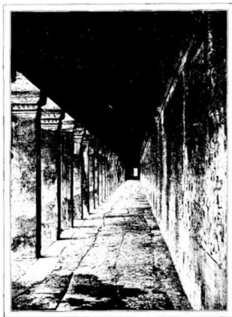
COLONNADES ET GALERIES COUVERTES DE BAS-RELIEFS (page 367).—D'APRÈS UNE PHOTOGRAPHIE.

Dans le mystère de la forêt, au milieu de ces ruines où les tigres parfois ont caché leurs petits, sous le regard de ces figures de pierre figées dans leur rêve éternel, l'imagination s'exalte, tente d'évoquer le passé; et parmi ces choses mortes, la vie rejailit, comme une étincelle dernière, des milliers de sculptures dont les pierres éparses sont couvertes et animées. Voici les monarques passant dans leur gloire sur leurs chars de combat, que traînent des chevaux caparaçonnés d'or; un cortège de prêtres et de courtisans les accompagne. Puis l'armée des guerriers, l'armée des esclaves, et fermant la marche, la prodigieuse cohorte des éléphants. Ce sont les bas-reliefs d'Angkor-Wat qui s'animent et défilent processionnellement sur l'immense chaussée entre le palais et le temple. Mais tout cela est mort à jamais; les pillards ont aidé le temps dans son travail de destruction, et les légendes même ont disparu de la mémoire du peuple, ignorant de sa glorieuse histoire.