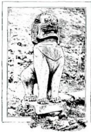
EMBLÈME DÉCORATIF (ART KHMER).—D'APRÈS UNE PHOTOGRAPHIE.