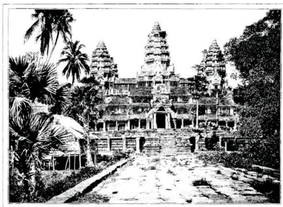
TROIS DÔMES HÉRISSENT SUPERBEMENT LA MASSE FORMIDABLE DU TEMPLE D'ANGKOR-WAT (page 363).—D'APRÈS UNE PHOTOGRAPHIE.

Les Fellahs n'ont-ils pas construit les Pyramides? N'est-ce pas aux Cinghalais qu'on doit les colosses d'Anuradhapura, dans l'île de Ceylan? Ces peuples asservis travaillaient pour le compte du maître, et par la puissance de leurs millions de bras, lui permettaient d'accomplir des prodiges auxquels leur intelligence n'avait nulle part. Machines humaines, ils se mouvaient sous la direction d'une élite peu nombreuse, et ils retournèrent à la simplicité de la nature, le jour où disparut cette aristocratie combinée de la puissance et du génie.