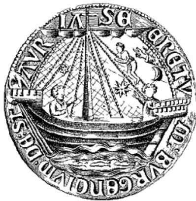
Afbeelding van een Schip met voor en achterplecht, bewaard op een oud zegel van Staveren.