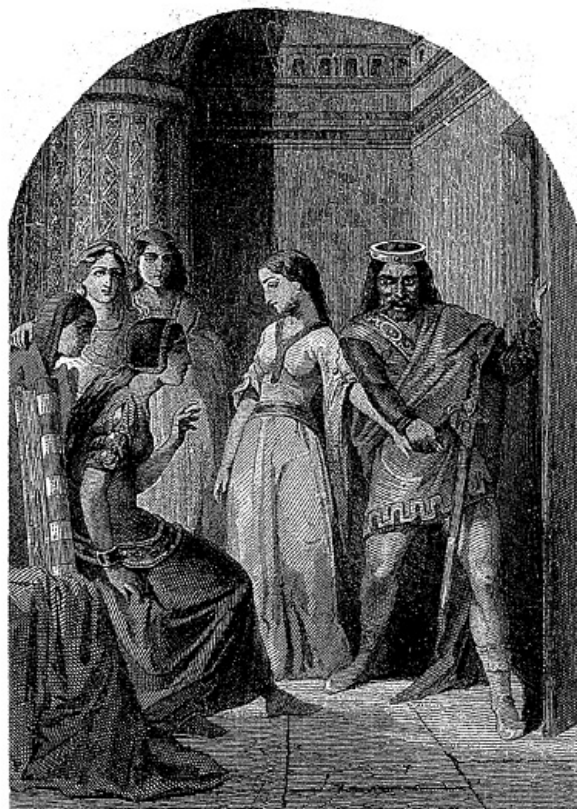
L'Epreuve des fers rouges.