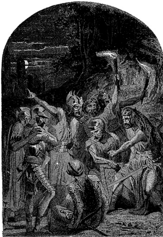
Les Vagres. Mort aux Oppresseurs. Liberté aux Esclaves.

Paris.--Imprimerie de madame veuve Dondey-Dupré, rue Saint-Louis, 46, au Marais.