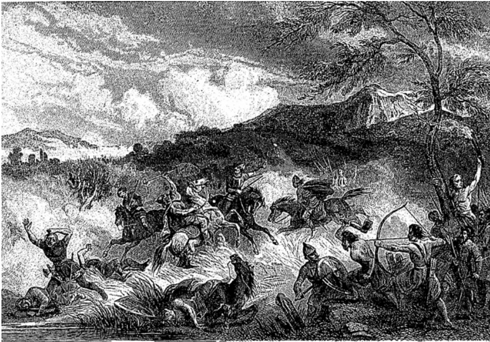
La Plaine embrasée.