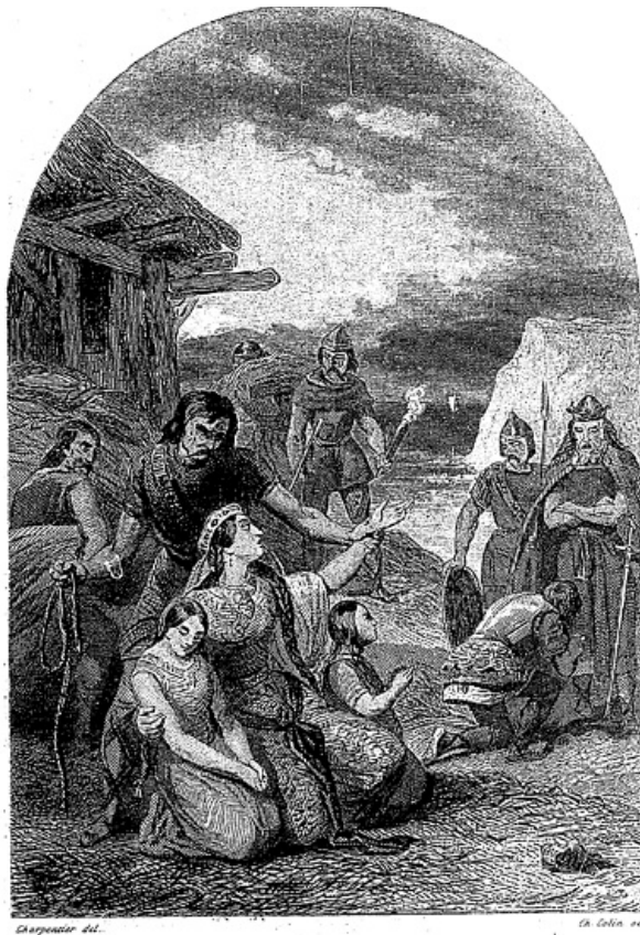
La mort du roi Chram et de sa famille.

*** END OF THE PROJECT GUTENBERG EBOOK LES MYSTÈRES DU PEUPLE, TOME IV ***