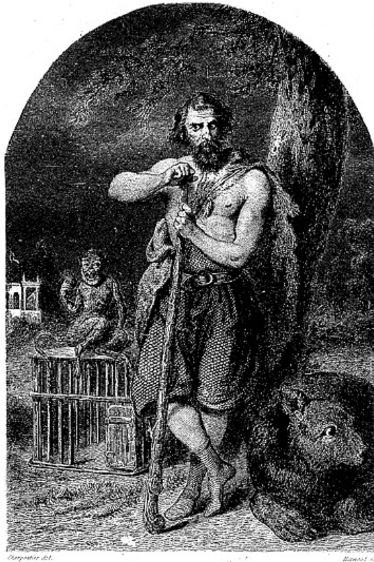
Karadeuk le Bagaude.