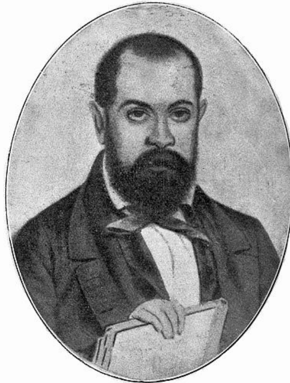
Domingo F. Sarmiento Cuando escribió el Facundo .

*** START OF THE PROJECT GUTENBERG EBOOK FACUNDO ***