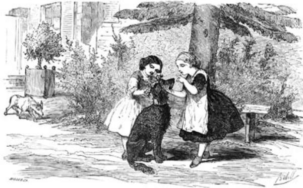
Le chien secouait la tête, la couronne tombait, et Marguerite le grondait. (Page 33.)