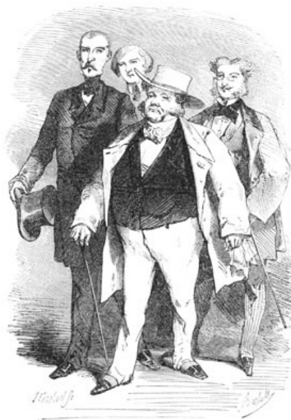
Mme de Fleurville avait à dîner quelques voisins.