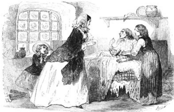
Mme de Rosbourg eut peine à retenir ses larmes. (Page 209.)