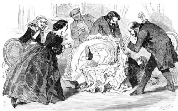
Un rire général salua cette chute.... (Page 79.)

Pourquoi n'as-tu pas changé de robe pour venir ici?