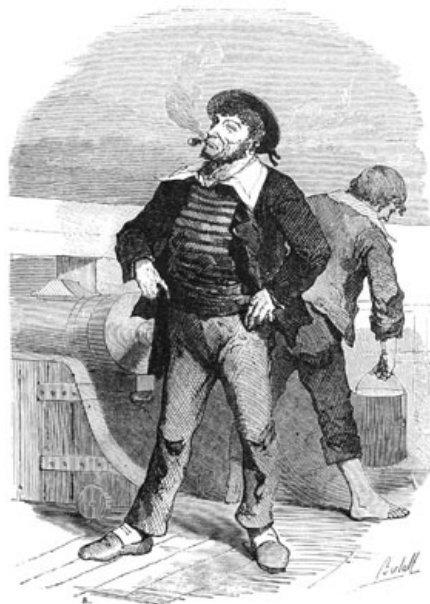
Un matelot de la Sibylle .