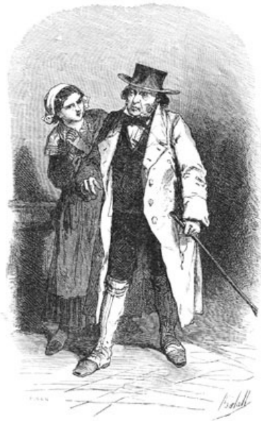
Le médecin ne vint que le soir. (Page 275.)