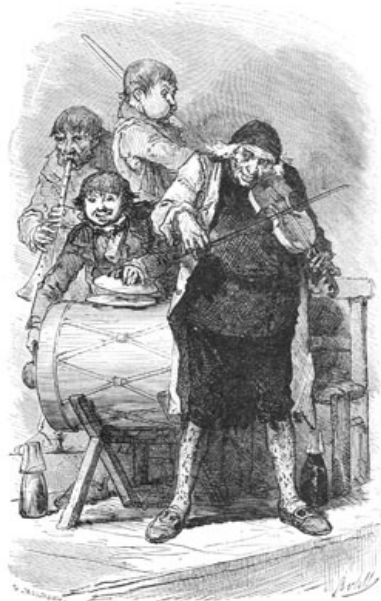
L'orchestre était composé de quatre musiciens. ( Page 293. )

Il a manqué de prendre feu, ce pauvre maigre; c'est qu'il aurait brûlé comme une allumette.