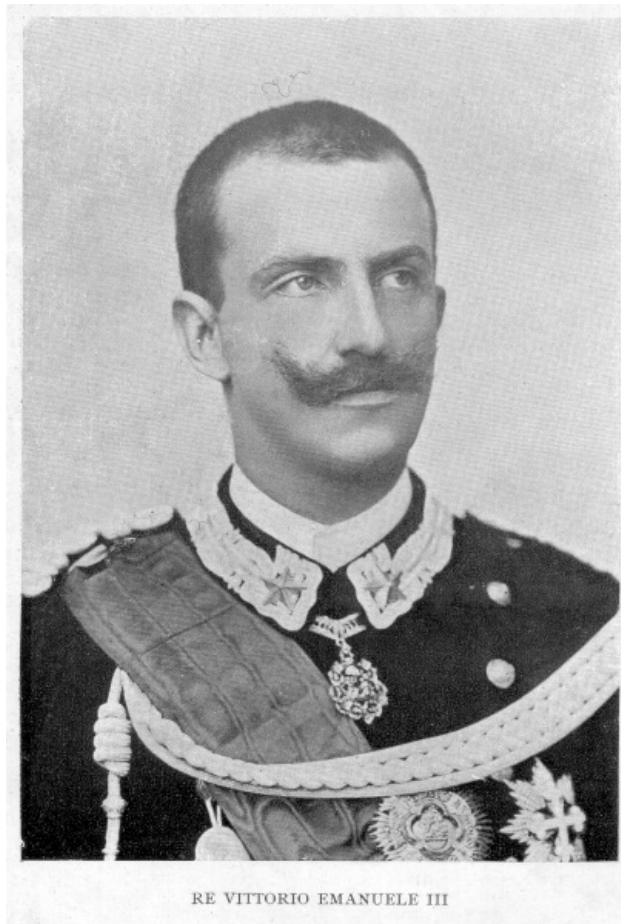
RE VITTORIO EMANUELE III

la volontà del padre, seguendone fedele gli esempi e avventurando la vita con lui e col fratello sui campi di Lombardia per la causa italiana. ( Benissimo! Bravo! )