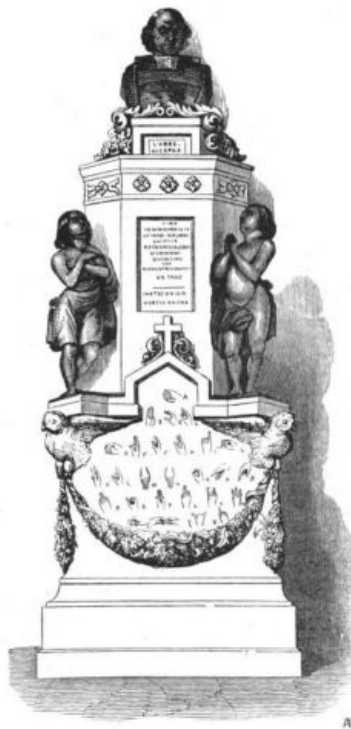
Monument de l'abbé de l'Épée dans une chapelle de l'Église Saint-Roch, à Paris.

Sculpteur, M. PRÉAULT. - Architecte, M. LASSUS.