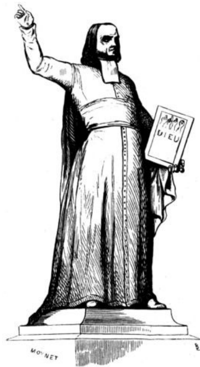
Statue de l'abbé de l'Épée, à Versailles. Par M. MICHAUT (Des Monnoies).

Inauguration de la statue de l'abbé de l'Épée à Versailles, sa ville natale.—Autorités, garde nationale, les sourds-muets de Paris et d'Orléans.—Désintéressement du chemin de fer.—Absence regrettable du clergé.—Nombreuse affluence de spectateurs.—Discours du préfet, au nom de la commission des souscripteurs. Réponse du maire.—Notice sur la vie et les travaux de l'abbé de l'Épée, par M. de Sainte-James, secrétaire de la commission du monument.—Mon allocution mimique.—Salves d'artillerie.—Absence du vénérable Paulmier.—Discours qu'il devait prononcer.