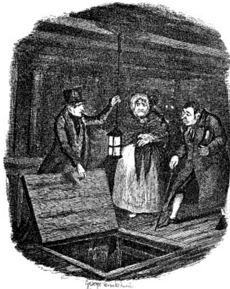
„KIJK NAAR BENEDEN,” ZEI MONKS, TERWIJL HIJ DE LANTAREN IN DE OPENING HIELD.

„Kijk naar beneden,” zei Monks, terwijl hij de lantaren in de opening hield. „Wees niet bang voor me. Als ik zooiets in mijn schild voerde, had ik u zonder moeite naar beneden kunnen laten, toen u er bovenop zat.”