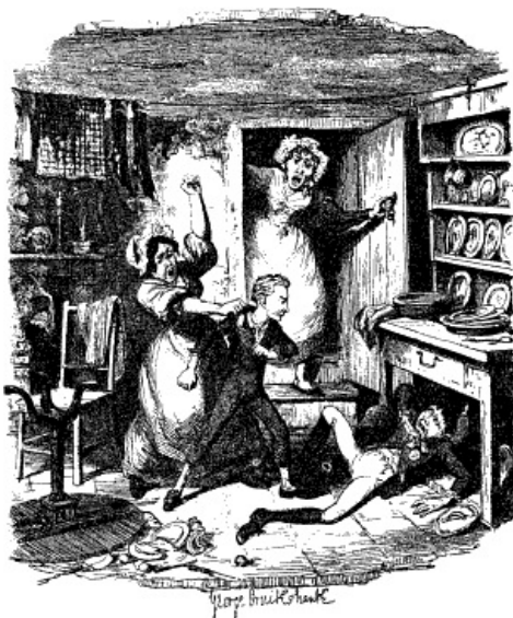
CHARLOTTE'S VUIST WAS NIET VAN DE KLEINSTE.

Charlotte's vuist was niet van de kleinste, maar alsof deze vuist nog niet voldoende in staat was Oliver's razernij tot kalmte te brengen, stormde juffrouw Sowerberry de keuken binnen en hield hem met één hand vast, terwijl zij met de andere zijn gezicht bewerkte. Bij dezen gunstigen stand van zaken stond Noah op van den grond en begon hem van achteren te stompen.