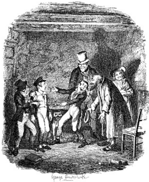
ZEER VERHEUGD U ZOO GOED GEKLEED TE ZIEN, MIJN WAARDE, ZEI DE JOOD MET EEN SPOTTENDE BUIGING.

Bij deze onbedwingbare uitbarsting van vroolijkheid liet Bates zich plat op den grond vallen en lag in overmaat van dolle vroolijkheid vijf minuten lang rumoerig met zijn beenen te schoppen. Toen sprong hij op en greep den gespleten stok van den Vos; om Oliver heen loopend, bekeek hij hem van alle kanten, terwijl de Jood, zijn slaapmuts afnemend voor den verbluften jongen, de ééne diepe buiging na de andere maakte. Intusschen begon de Slimme, die van een zwaarmoediger temperament was en zich zelden aan vroolijkheid overgaf, wanneer er zaken te doen waren, Oliver's zakken met grooten ijver te doorzoeken.