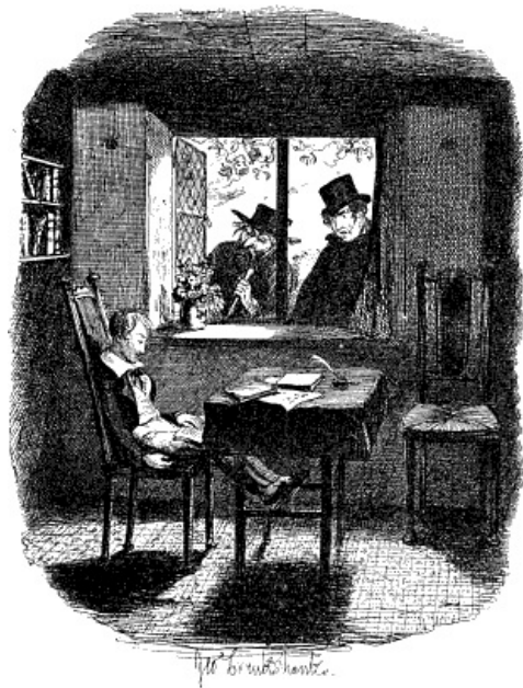
„ST.... VRIEND! MEENDE HIJ TE HOOREN ZEGGEN.... HIJ IS 'T STELLIG.”

Op een mooien avond, toen de eerste schaduwen der schemering op de aarde nederdaalden, zat Oliver vóór dit raam, ingespannen bezig met zijn boeken. Een tijd lang had hij zich in zijn boek verdiept en daar de dag drukkend warm was geweest en hij zich nogal had ingespannen, ligt er geen minachting in voor den schrijver van dat boek, wie het ook zij, wanneer ik zeg, dat Oliver langzamerhand in slaap viel.