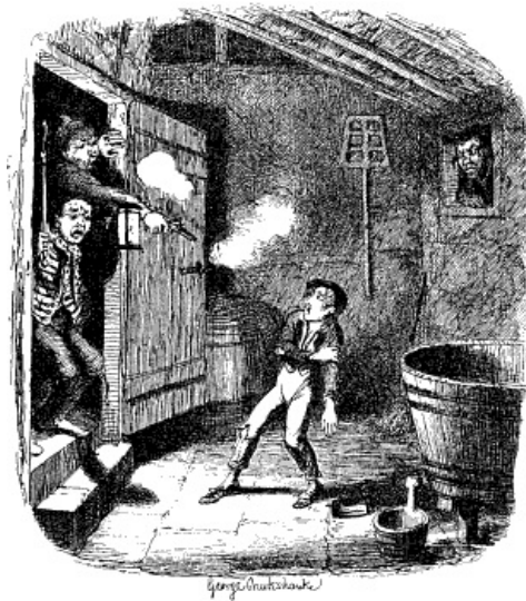
DE KREET WERD HERHAALD.... EEN FLITS.... EEN HARD GELUID.... ROOK, EEN GEKRAAK ERGENS, WAAR WIST HIJ NIET....

„Hou me steviger vast,” zei Sikes, terwijl hij hem door het raam trok. „Geef me een doek. Ze hebben 'm geraakt. Gauw! Vervloekt, wat bloedt de jongen.”