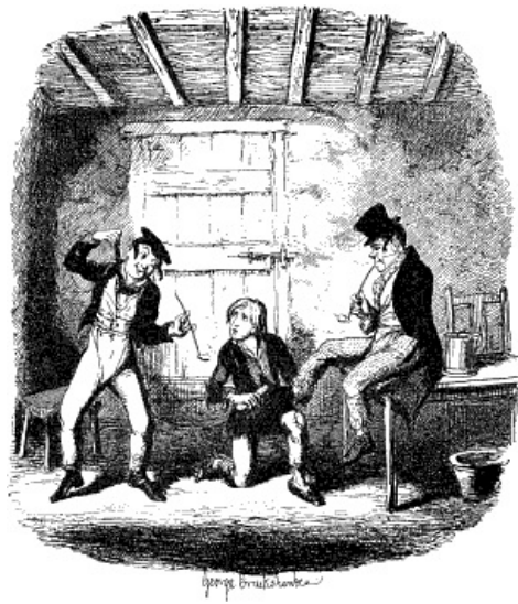
WAT IN GEWONE TAAL OVERGEBRACHT, SCHOENPOETSEN BETEKENDE.

Of het 't gevoel was van vrijheid en onafhankelijkheid, dat een zedelijk wezen allicht zal ondervinden, wanneer hij in een gemakkelijke houding op een tafel zit, zijn pijp rookend, en één been losjes heen en weer slingerend, terwijl zijn schoenen gepoetst worden zonder zelfs de herinnering aan de moeite ze uit te doen, of het vooruitzicht van de last, ze weer aan te moeten trekken; of dat de goede tabak den Vos zachter stemde of het bier zijn gedachten weeker maakte, zeker is, dat hij voor 't oogenblik in een romantische, levendige stemming verkeerde, die anders vreemd was aan zijn aard. Een korte poos keek hij met een peinzend gezicht op Oliver neer; toen hief hij 't hoofd op, loosde een lichten zucht en zeide, half in 't vage, half tot Charley: