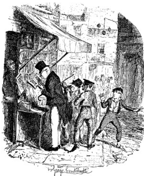
OLIVER ZAG DE HAND VAN „DEN VOS” VERDWIJNEN IN DE ZAK VAN DEN OUDEN HEER.

„St!” antwoordde de Vos. „Zie je die oude kerel bij het boekenstalletje?” [95]