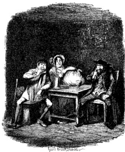
FAGIN ZETTE DEZE OPMERKING KRACHT BIJ, DOOR MET ZIJN RECHTER WIJSVINGER LANGS DEN KANT VAN ZIJN NEUS TE STRIJKEN.

„Wat zou ik er aan hebben, het te zeggen als ik 't niet meende?” vroeg Fagin, zijn schouders ophalend. „Hier! Laat me buiten de kamer een woordje met u alleen spreken.”