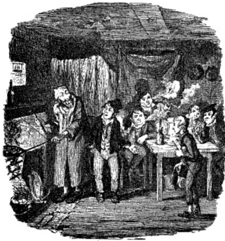
EEN STOKOUDE, GERIMPELDE JOOD STOND MET EEN LANGE VORK IN DE HAND BIJ DE PAN.

Het laatste gedeelte van deze toespraak riep bij al de veelbelovende leerlingen van den vroolijken heer een schaterende lachuitbarsting te voorschijn. Zij lachten nog terwijl zij aan het avondeten gingen. Oliver at zijn deel op en de Jood mengde voor hem een glas heete jenevergroc, met de bijvoeging dat hij het dadelijk op moest drinken, omdat een van de andere heeren het glas moest hebben. Oliver deed zooals hem werd bevolen. Dadelijk daarop voelde hij hoe hij zachtjes werd opgetild en op één van de zakken neergelegd, en toen zonk hij in diepen slaap. [83] [84] [85]