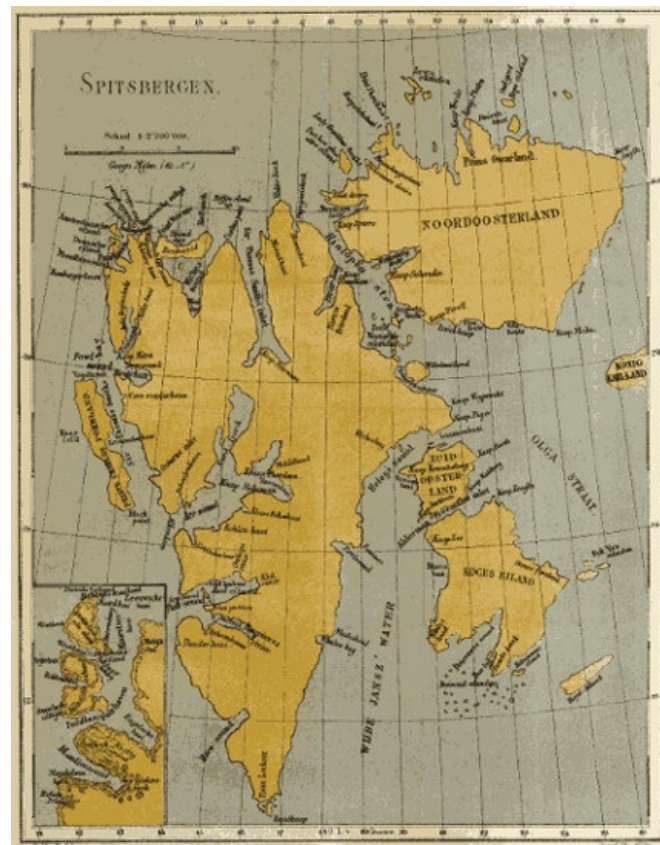
Grote kaart (1170 x 1500 pixels, 894 kB)