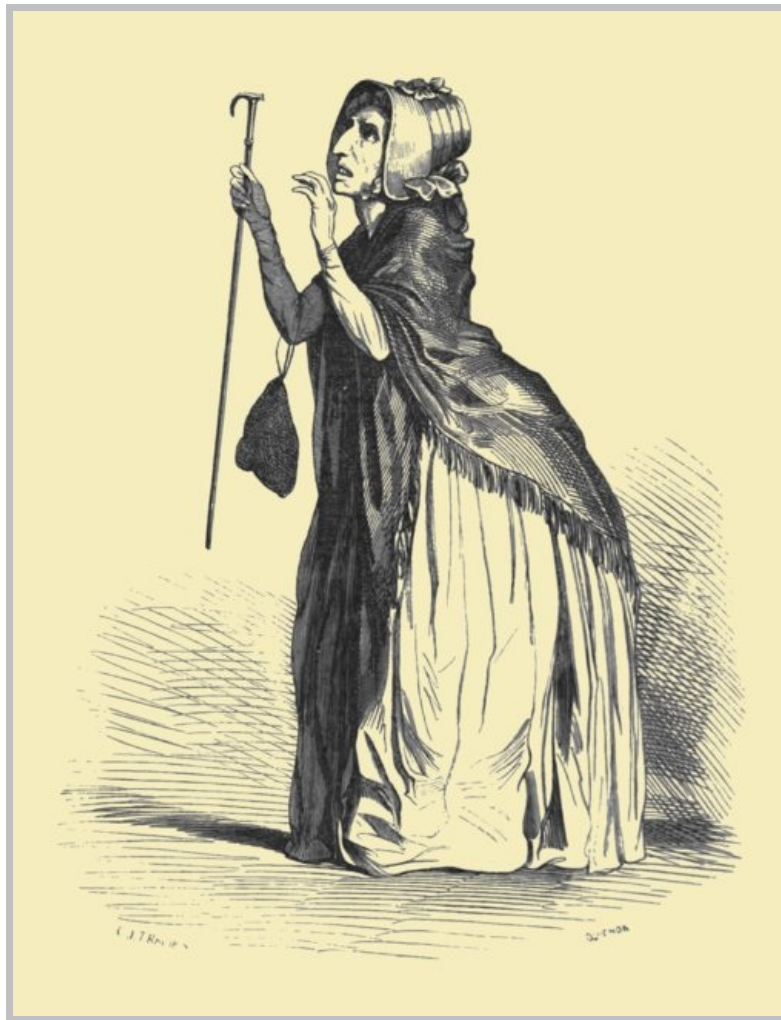
MADemoiselle DE PEN-HOËL.