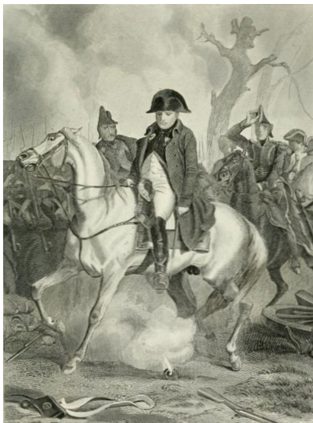
NAPOLÉON À BRIENNE.

Napoléon se dirige à la hâte sur Fontainebleau[428]: là une sainte victime, en se retirant, avait laissé le rémunérateur et le vengeur. Toujours dans l'histoire marchent ensemble deux choses: qu'un homme s'ouvre une voie d'injustice, il s'ouvre en même temps une voie de perdition dans laquelle, à une distance marquée, la première route vient tomber dans la seconde.