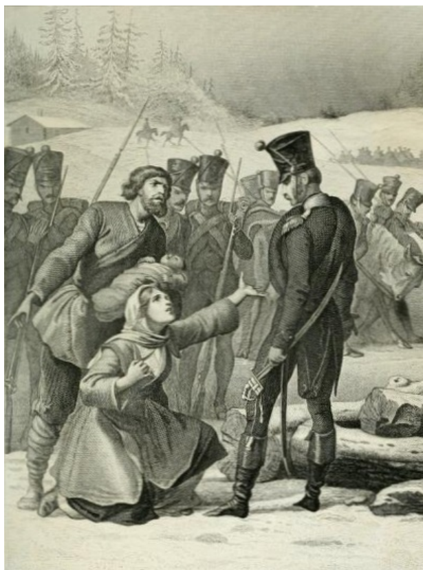
ÉPISODE DE LA GUERRE DE RUSSIE.

Bonaparte ne voyait plus d'ennemis; ne sachant où prendre des empires, faute de mieux il avait pris le royaume de Hollande à son frère. Mais une inimitié secrète, qui remontait à l'époque de la mort du duc d'Enghien, était restée au fond du cœur de Napoléon contre Alexandre. Une rivalité de puissance l'animait; il savait ce que la Russie pouvait faire et à quel prix il avait acheté les victoires de Friedland et d'Eylau. Les entrevues de Tilsit et d'Erfurt, des suspensions d'armes forcées, une paix que le caractère de Bonaparte ne pouvait supporter, des déclarations d'amitié, des serrements de main, des embrassades, des projets fantastiques de conquêtes communes, tout cela n'était que des ajournements de haine. Il restait sur le continent un pays et des capitales où Napoléon n'était point entré, un empire debout en face de l'empire français: les deux colosses se devaient mesurer. À force d'étendre la France, Bonaparte avait rencontré les Russes, comme Trajan, en passant le Danube, avait rencontré les Goths.