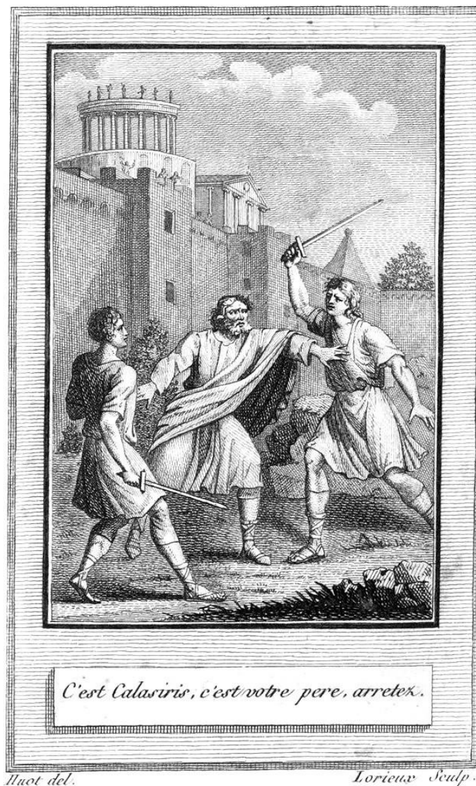
C'est Calasiris, c'est votre père, arrêtez. — Dessin: Huot — Sculp.: Lorieux.